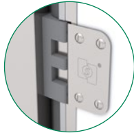
Edelstahlscharnier von SPENLE