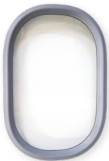
350 x 550 mm aus STADIP-Verbund-Sicherheitsglas mit EPDM-Dichtung