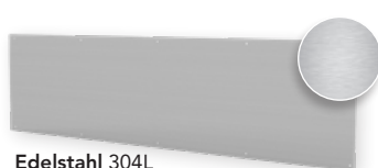
Edelstahl 304L gebürstet, Stärke 0,8 mm