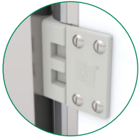
Scharnier von SPENLE aus Delrin® mit Edelstahl-Mechanismus