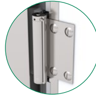
Beidseitig wirkende Pendelscharniere aus Edelstahl