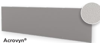
Acrovyn® Stärke 1,5 mm