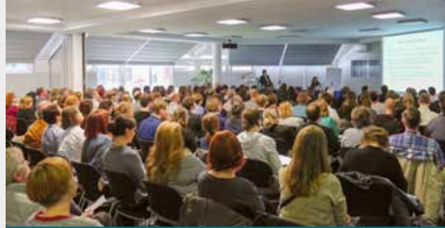
Fachgespräche der NRW-Papierrestauratoren in Bonn