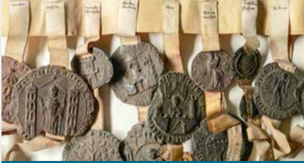
Urkunde mit Wachsiegeln