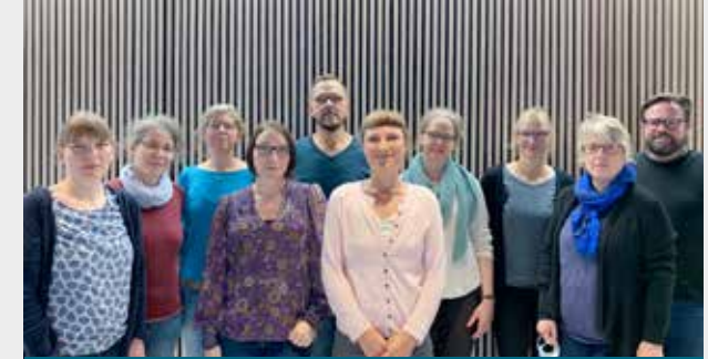
Die Mitglieder des Arbeitskreises