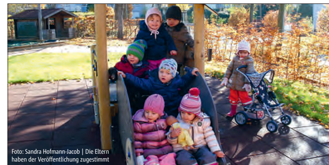
Die Eltern haben der Veröffentlichung zugestimmt