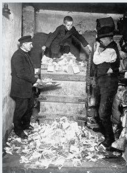
Bei einem Lumpensammler wandern wertlose Geldscheine in die Papierpresse.