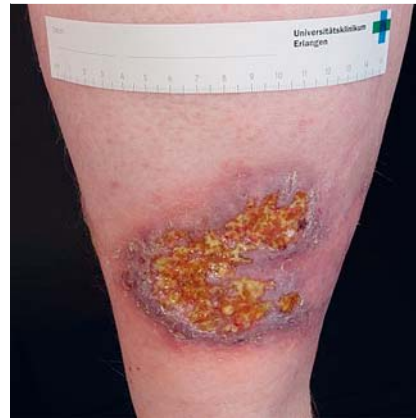
Abb. 3 Typisches klinisches Erscheinungsbild eines Pyoderma gangränosum.

gruppe unterschiedliche Krankheitsbilder wie Polyarteriitis nodosa, Systemvaskulitiden wie Morbus Wegener oder Immunkomplex-assoziierte Vaskulitiden zählen, sind kutane Ulzerationen ein häufig zu findendes Zeichen dieser Erkrankungen im Zuge des entzündungsbedingten Verschlusses von Gefäßen unterschiedlichen Kalibers. Auch das immer noch kaum verstandene Krankheitsbild des Pyoderma gangränosum war mit einer Häufigkeit von 3% relativ oft vertreten [2]. Die Diagnosestellung ergibt sich bei dieser Erkrankung vorwiegend aus dem klinischen