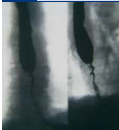
Abb. 2a Stenosierung des distalen Ösophagus bei Morbus Crohn