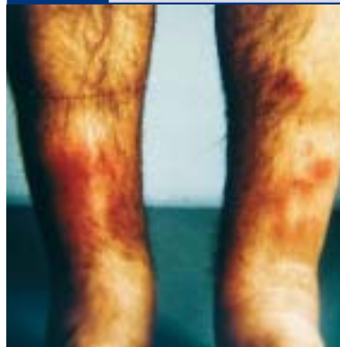
Abb. 6a Erythema nodosum bei CED