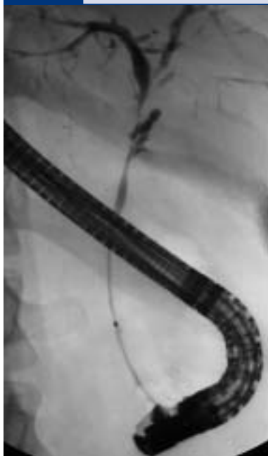
Abb. 8a Kombinierte intra- und extrahepatische Stenosierung der Gallenwege durch primär sklerosierende Cholangitis bei Colitis ulcerosa

so ist es derzeit nicht möglich, die absolute Häufigkeit hepatobiliärer Zweiterkrankungen exakt festzulegen. Entsprechend lassen sich Komplikationen abgrenzen, die sowohl beim M.C. als auch bei C.U. auftreten beziehungsweise die nur überwiegend bei M.C. oder C.U. gehäuft zu beachten sind (Tab. 5).