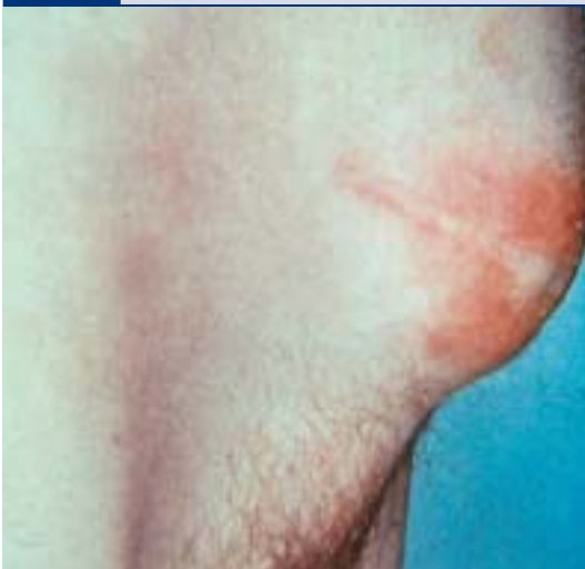
Abb. 4 Hautirritation bei enterokutaner, hoher Fistel nach Dünndarmresektion bei Morbus Crohn

Anti-TNF-Substanzen (Infliximab) zeigen Therapieeffekte schon nach circa 14 Tagen bei etwa 50% der Patienten. Aufgrund der hohen Rezidivrate und des Nebenwirkungsprofils wird diese Medikation zur Zeit als Überbrückungsregime bei therapierefraktären Fisteln bis zur operativen Sanierung empfohlen. Eine operative Fistelspaltung ist für subkutane Fisteln und in Einzelfällen für intrasphinkteräre Fisteln angezeigt. Bei transsphinkterären Fisteln wird zunächst eine Fadendrainage durchgeführt, um entzündliche Sekrete abzuleiten. Plastische Deckungen sind im Einzelfall möglich und sollten in speziellen Zentren durchgeführt werden. Bei massivem Befall des Rektums und kompletter Zerstörung des Sphinkterapparates besteht die Indikation zur Proktektomie.