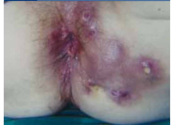
Abb. 3 Perianale Fisteln bei Morbus Crohn

optisch kontrolliert werden und im Zweifelsfall ist die Indikation zur Operation gegeben.