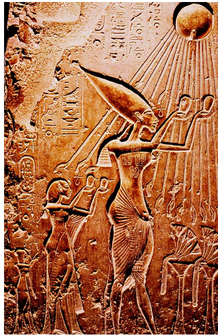
Abb. 1 Amarna-Kultur in Ägypten (1364–1348 v. Chr.). Menschen und Pflanzen empfangen die Leben spendenden Sonnenstrahlen und der Priester-König Echnaton huldigt dem allein herrschenden Sonnengott Aton.

Die Sonne wird denn auch im Mittelalter wiederholt in den Dienst der Lobpreisung Gottes gestellt. Franziskus von Assisi, der Gründer des Franziskaner-Ordens, besingt 1224 in seinem Sonnengesang ( Cantico di Frate Sole ) den Bruder Sonne und die Schwester Mond und beschwört beide, ihn in der Lobpreisung Gottes zu unterstützen. Ähnliches hat der Dominikaner-Mönch Tommaso Campanella 1602 ausgedrückt, als er im Gefängnis seinen utopischen Roman „ Città del Sole “ schrieb und einen idealisierten Sonnenstaat beschrieb.