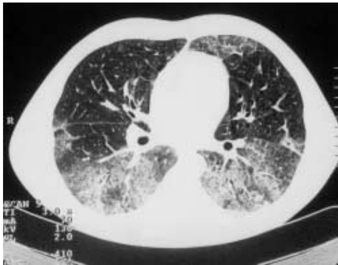
Abb. 8 CT-Thorax bei akuter eosinophiler Pneumonie.