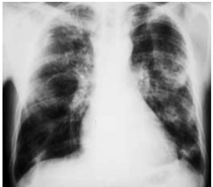
Abb. 7 Röntgen-Thoraxbild bei akuter eosinophiler Pneumonie.

Im Frühjahr 1998 wurde uns aus einem auswärtigen Krankenhaus ein nahezu moribunder 30-jähriger Mann verlegt. Die Symptomatik war ganz akut 4 Tage vor der Klinikaufnahme aufgetreten. Eine Atopie mit allergischer Rhinopathie war vorbekannt. Mehrfache kombinierte antibiotische Behandlungen hatten weder das klinische Bild mit hohen, teils septischen Temperaturen beeinflussen noch die beidseitigen Infiltrationen der Lunge verändern können (s. Abb. 7). Im Gegenteil, ein Computertomogramm der Thoraxorgane zeigte ausgeprägte beidseitige Veränderungen (Abb. 8).