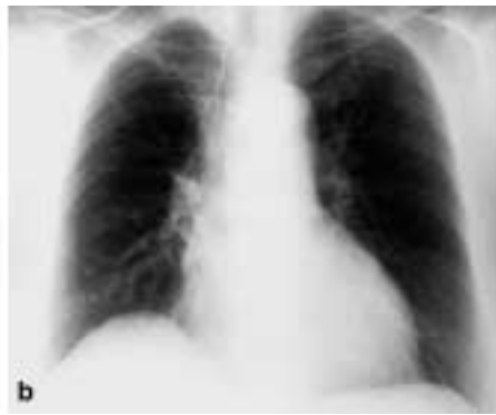
Abb. 3–6 Röntgenbilder des Thorax bei 4 Patienten mit CEP a vor und b nach Therapie.