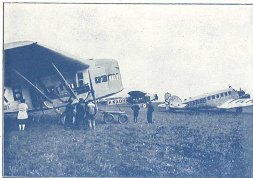
For Starten i Kastrup Lufthavn. Til venstre D. D. L.'s Jubiru, i Midten K. L. M.'s Fokker VII, til højre A.-B. A.'s Junker, i Baggrunden skimtes Deutsche Lufthansas Junker.