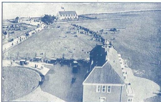
Kastrup Lufthavn. I Forgrunden Administrationsbygningen, i Baggrunden Lufthavnens Restaurant „Krudtuset“.

DANSK-INTERNATIONALE LUFTRUTER (Danish-International Air-Lines)