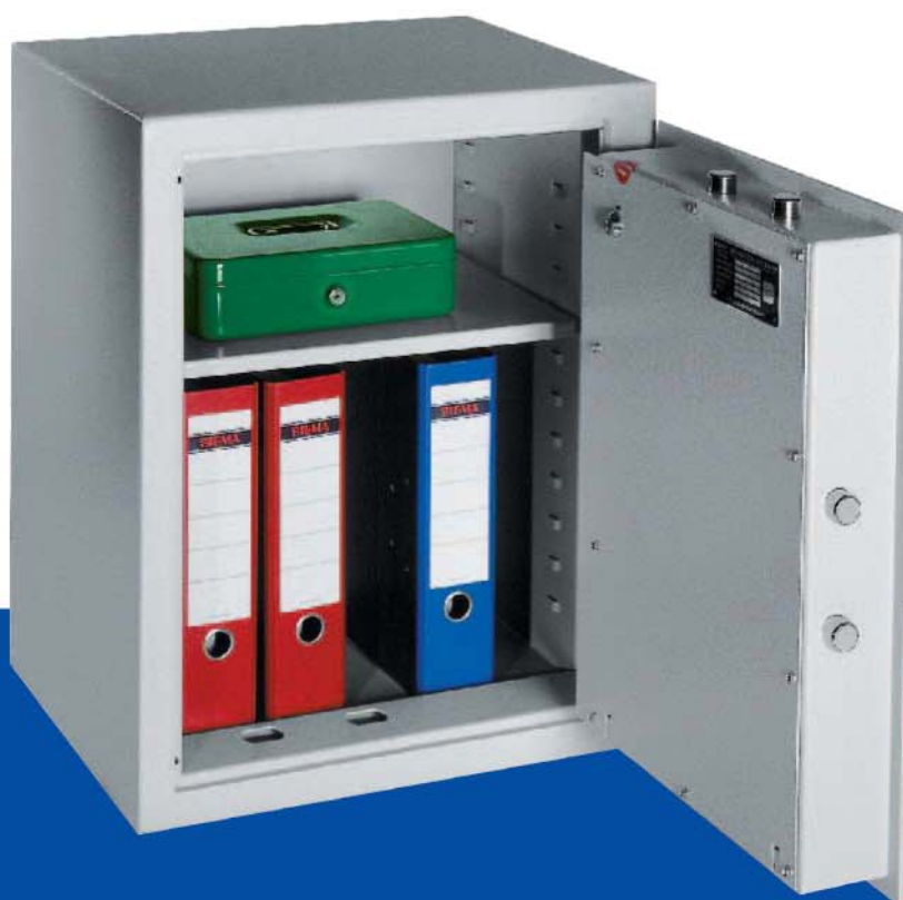
Abbildung NM 10-05