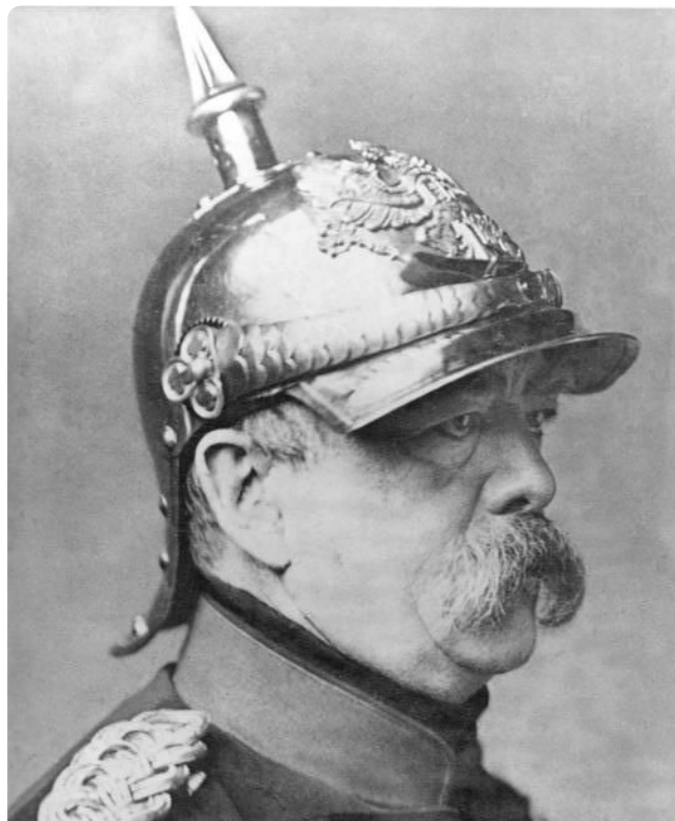
M1: Otto von Bismarck 1871, Bundesarchiv, Bild 183-R68588, P. Loescher & Petsch, CC-BY-SA 3.0, https://t1p.de/bc78