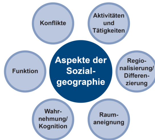
Figur 1: Die sechs Aspekte sozialgeographischen Denkens

Um Ihnen diese zunächst unbestimmten Aspekte in ihrer allgemeinen Bedeutung verständlich zu machen und sie mit Leben zu füllen, versetzen Sie sich am besten in einfache Alltagssituationen. Stellen Sie sich einfach einen größeren städtischen Park, wie etwa den Bamberger Hain, bestehend aus Theresien- und Luisenhain, oder den Volkspark im Bamberger Osten vor; am Beispiel des Parks werden wir nachfolgend die Relevanz der sechs Aspekte der Sozialgeographie erläutern.