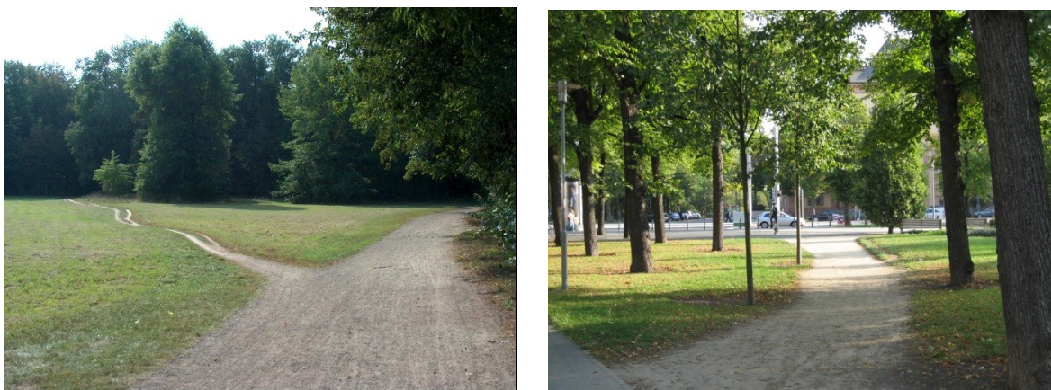
Figur 5: Trampelpfade im Leipziger Rosental

gen durch Menschen beobachten; gerade bei pragmatisch motivierten Raumeignungen ist das häufig der Fall. Unsere Aktivitäten und Tätigkeiten legen oft eine gewisse Widerständigkeit gegenüber etablierten und vorgeschriebenen Raumnutzungsmustern an den Tag: In einem Park sieht man Trampelpfade, wie jene auf den beiden Fotos unten. Sie verändern die Vegetation (bestimmte Pflanzen mit höherer Trittresistenz setzen sich durch) oder vernichten diese und verändern damit die Physische Geographie eines Parks (das ist der Fall bei den Fotos). Solche Trampelpfade sind Ausdruck eines wohl eher unbewussten und intuitiven „Wehrens“ gegen ein durch die Parkverwaltung und Grünplanung vorgeschriebenes Wegenetz, das als unangemessen erachtet wird, etwa weil es unsinnige und längere Wege „vorschreibt“ (der rechte Trampelpfad ist der schnellste Weg zu einer Straßenbahnhaltestelle ...). All das ist durchaus politisch wie planerisch relevant: Die Planung kann über solche, auch räumlich ja meist gut sichtbaren Abweichungen lernen, beim nächsten Mal enger an den Bedürfnissen der Menschen zu planen.