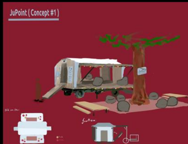
Design- u. Nutzungskonzept