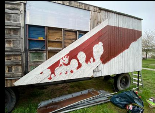
Visuelle Idee u. Umsetzung