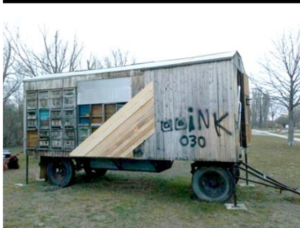
JuPoint – Pop-Up Treff