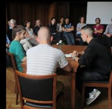
Spiele zu Fachthemen