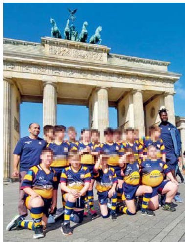
Die U12 in Berlin.

Tolles Turnier von der U12 mit einem Gastspieler aus Bayreuth bei der Deutschen Meisterschaft in Berlin. Die Trainer sind unglaublich stolz auf die Leistung der Kinder und wie sie sich über das Turnier hinweg weiterentwickelt haben. Sie haben sehr viel dazu gelernt und viel Lob von allen Mannschaften, gegen die sie gespielt haben, bekommen. Auf ihrem Weg zum zehnten Platz von insgesamt 15 Mannschaften (die beste Platzierung einer bayerischen Rugby U12-Mannschaft in der Geschichte) verlor der RCU am ersten Turniertag knapp 15:20 gegen den Hamburger RC, den spä-