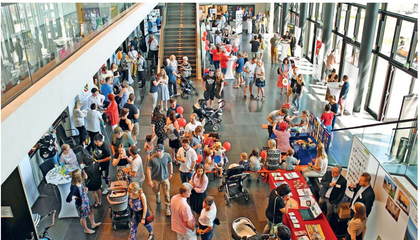
Neubürgerempfang im Foyer des Bürgerhauses.

Die Gemeinde dankt für die gute Zusammenarbeit und den großen Einsatz der Vereine. Sie haben Unterföhring einen wunderschönen Sonntag beschert.