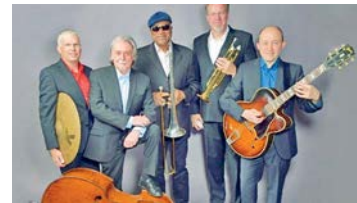
The Hot Stuff Jazzband.

Mit Swing und Jazz der Extraklasse legt die Hot-Stuff-Jazzband am Sonntag, 19. Juni um 11 Uhr am S-Bahnhof einen groovigen, erdigen „Mini Big Band Sound“ an den Tag, der seinesgleichen sucht. Das Repertoire reicht von ausgewählten Songs aus den 30er Jahren wie „Running Wild“ aus dem Film „Some Like It Hot“, über Jazz Klassiker wie „Perdido“ und „It Don't Mean A Thing“ von Duke Ellington, bis hin zu den 70er Jahren mit funkyen und karibischen Rhythmen wie „Sly Mon-goose“ oder „Coming Home Baby“. Sogar ein Evergreen aus der Popwelt von Billy Joel „Just The Way You Are“ findet seinen Platz im Programm. Der Eintritt ist frei.