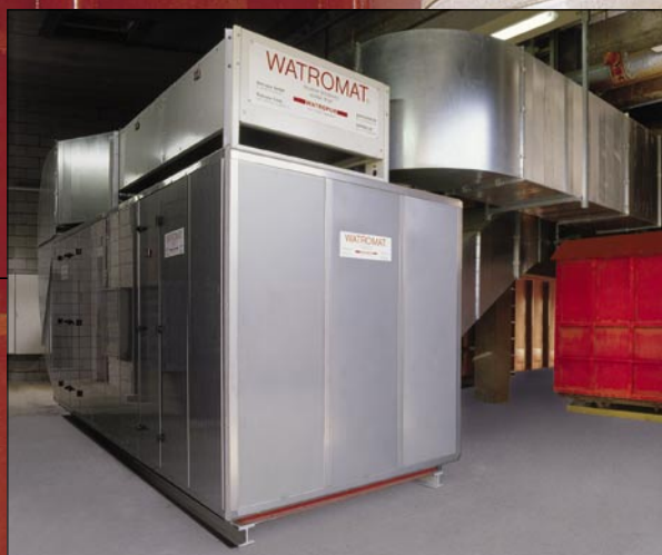
Trockenluftgenerator WATROMAT® 6000 S mit Schlammcontainer 30m3 (Wasserentzugsleistung: ca. 6000 kg Wasser/Tag)