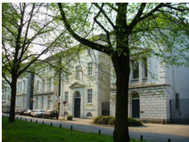
Nordischer Klassizismus in Altona, rechts das Wohnhaus des Architekten C.F. Hansen