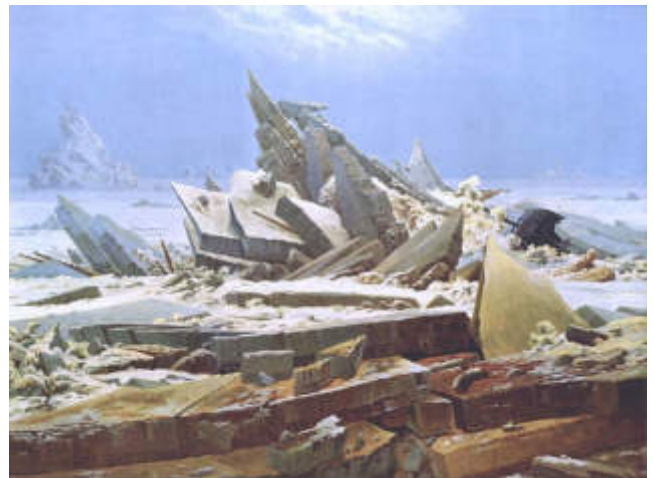
Das Eismeer, Caspar David Friedrich, 1823–1824 Öl auf Leinwand, Hamburger Kunsthalle

Um 14:00 Uhr dann Führung durch die Caspar David Friedrich-Jubiläumsausstellung, die die Kunsthalle zum 250. Geburtstag des großen deutschen Romantikers zeigt. Es handelt sich um die erste große C.D. Friedrich-Retrospektive seit langem. Die Ausstellung verspricht Dank hochwertiger Leihgaben, über 50 Gemälden, rund 90 Zeichnungen sowie ausgewählten Arbeiten seiner Künstlerfreunde ein internationaler Erfolg zu werden.