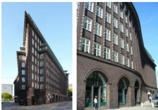
Das Chilehaus (beide Fotos) zählt zu den Kontorhäusern, die im Stil des Backstein-Expressionismus errichtet wurden

Rückfahrt in die Innenstadt. Hierbei lernen Sie das Kontorhausviertel kennen, das gemeinsam mit der Speicherstadt zum UNESCO-Welterbe zählt.