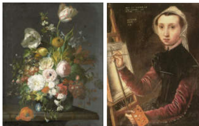
links: Rachel Ruysch, Stilleben mit Blumen in einer Glasvase, ca. 1690-1720, Rijksmuseum Amsterdam rechts: Catharina van Hemessen: Selbstbildnis an der Staffelei, 1548 Kunstmuseum Basel

Am späten Vormittag geht es dann ins Bucerius Kunst Forum. Die Ausstellung „Geniale Frauen. Malerei vom 16. bis 18. Jahrhundert“ leistet echte Pionierarbeit, indem sie die wichtigsten Malerinnen vom 16. bis 18. Jahrhundert vorstellt. Es handelt sich allesamt um Frauen, die sich in der damals noch von Männern dominierten Kunstszene durchsetzen konnten – weil sie über außerordentliches Talent und hervorragende technische Fertigkeiten verfügten, aber auch, weil sie im direkten Umfeld wichtige (männliche) Fürsprecher und Förderer hatten. Diese Ausstellung rückt den Fokus endlich auf die weibliche Seite der Kunstgeschichte!