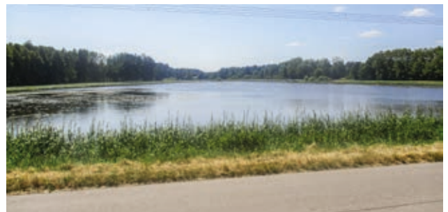
Der ca. 6 ha große Kettnitzmühlweiher (früher Mühlweiher) wird vom Feistenbach gespeist und ist ein „Wahrzeichen“ von Wernberg-Köblitz.