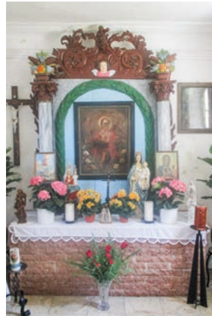
Altar der Kapelle mit dem Jesuskind-Bild