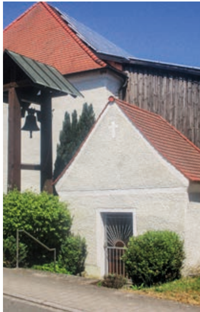
Ehemalige Schlosskapelle in Kettnitzmühle. Wie das zugehörige Hauptgebäude wurde sie im 18. Jahrhundert erbaut und dem Jesuskind gewidmet. Die jetzige Glocke wurde am 9. Mai 1950 von Pfarrer J. B. Wagner geweiht.