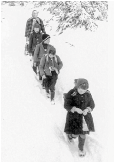
Schulweg durch den oft bis ins Frühjahr verschneiten Wald