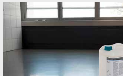
Nach der Behandlung mit Mepol HM