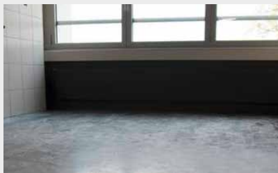
Stark beanspruchter Bodenbelag

Bei jedem Bodenbelag stellt sich irgendwann die Frage der Erneuerung oder Ersetzung. In der Vergangenheit war ein Ersatz über kurz oder lang meist notwendig. Mepol HM ist das erste wieder entfernbare Produkt zur Bodenbeschichtung, das stark strapazierte Böden praktisch in den Neuzustand zurückversetzen kann. Die Nutzungsdauer verlängert sich um Jahre.