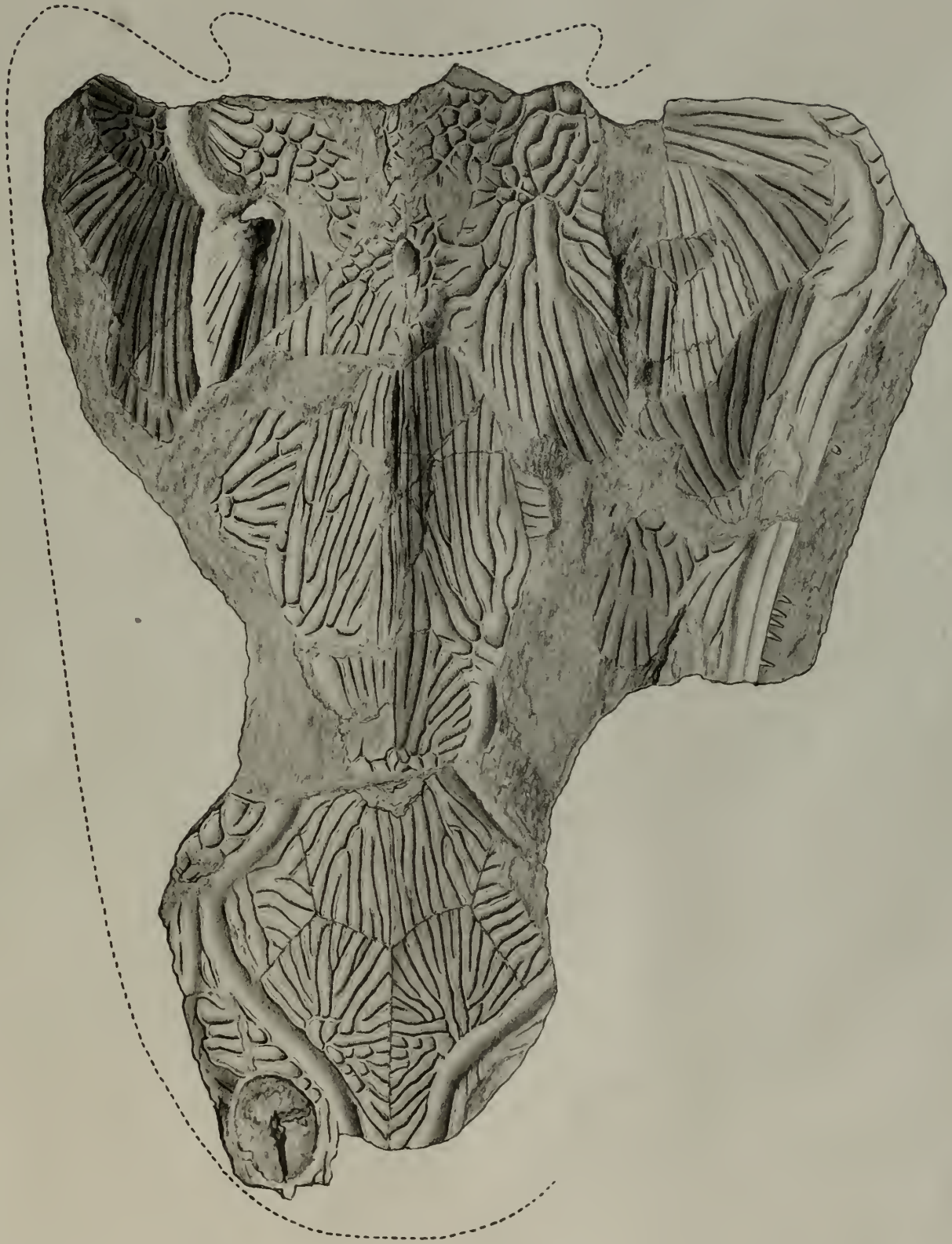
A. Birkmaier gez.