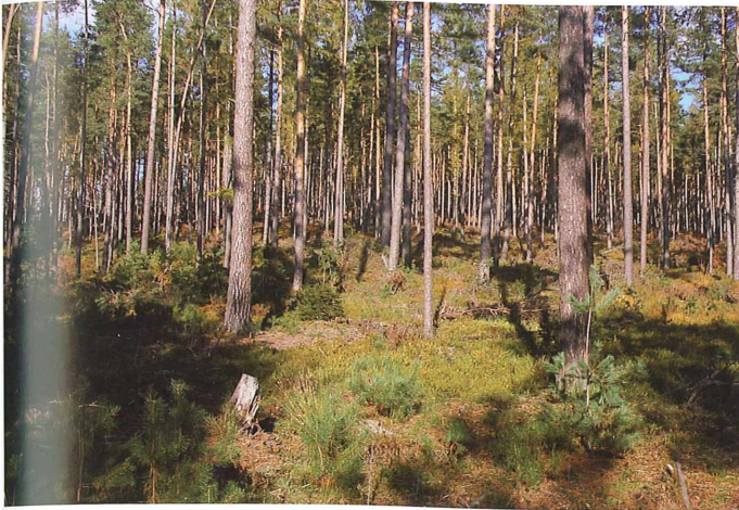
Abb. 3. Auerhuhnlebensraum im Aussetzungsgebiet Langer Berg. – Capercaillie habitat in the release area at Langer Berg.