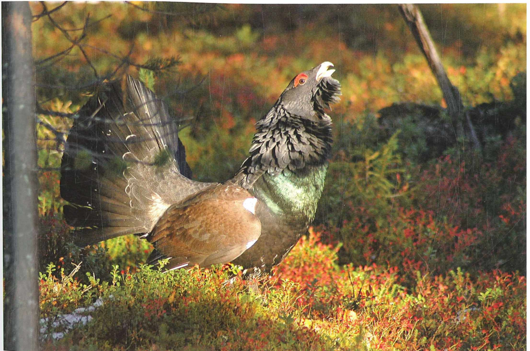
Abb. 4. Zweijähriger Auerhahn zeigt Territorialverhalten im Herbst. – Two-year-old Capercaillie cock showing territorial behaviour in autumn.

blieben. Momentan wird der Frühjahresbestand des Auerhuhnes im Thüringer Schiefergebirge auf 25 bis 35 Vögel geschätzt. Ganz entscheidend für die langfristige Erhaltung dieser Art in Thüringens Wäldern ist die Erweiterung des arttypischen Lebensraumes: alte, lückige, kiefernreiche Bestände mit reichen Heidelbeervor-