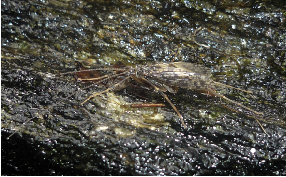
Abbildung/Figure 11: Imago von Rhyacophila ferox . Adult Rhyacophila ferox .

Komplex zeigt eine deutliche Diversifizierung entlang des longitudinalen und latitudinalen Gradienten. Er kommt in sechs Unterarten in Europa vor: R. f. aliena (Kaukasus), R. f. denticulata (Spanien), R. f. kykladica (Griechenland), R. f.