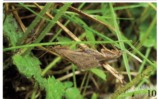
Abbildung/Figure 10: Kopula von Rhyacophila fasciata . Copula of Rhyacophila fasciata .

unterschiedlichen Arten zu beobachten ist. Dabei sind kiemenlose Larven auf die höhergelegenen Quellbereiche beschränkt. Die Rhyacophila sensu stricto-Gruppe, zu der auch Rhyacophila fasciata zählt, besiedelt dabei als einzige die flussab gelegenen Bereiche, kommt jedoch auch bis in die Quellregionen vor.