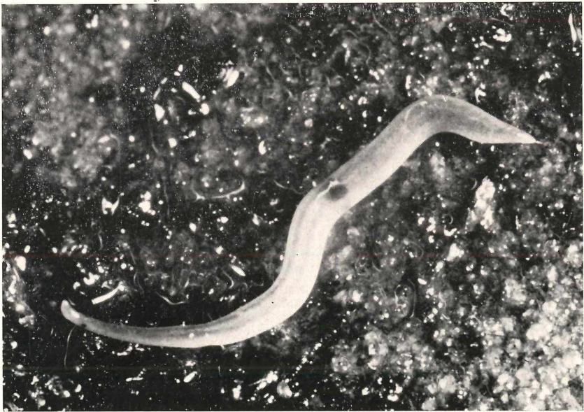
Abb. 1: Rhynchodemus bilineatus (links im Bild das spatelförmige Vorderende mit den beiden Augen; in der Mitte unter dem dunklen Fleck die Pharynx-Region).

Rhynchodemus bilineatus beobachtete ich in großer Zahl und mehrere Monate in einem mit Torf gefüllten Blumenkasten. Der Torf war durch das tägliche Gießen feucht, aber niemals naß. In seinem Lückensystem lebten Collembolen, Brachydesmiden, Isopoden, Gastropoden und Rh. bilineatus . Am häufigsten hielten sich die Turbellarien auf der feuchten Außenseite