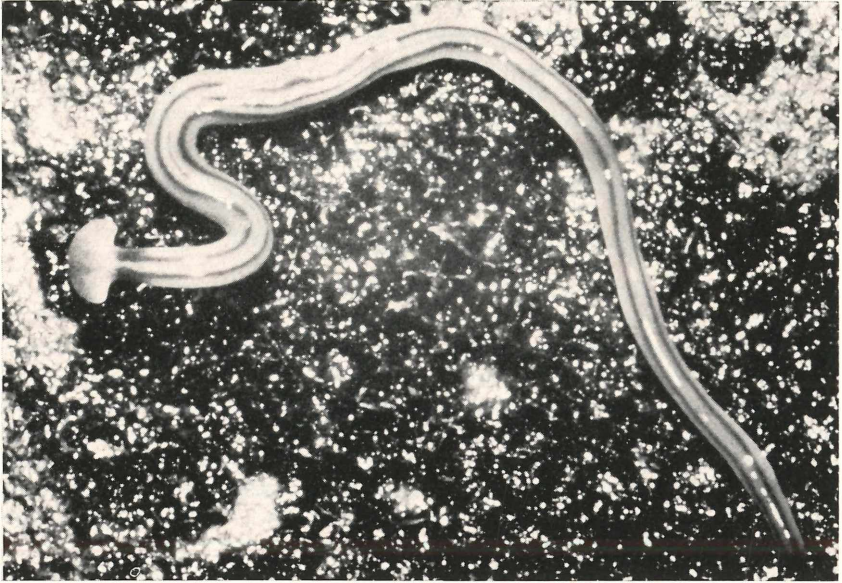
Abb. 2: Bipalium kewense (links im Bild der halbkreisförmige Kopf; dieses Tier war etwa 20 cm lang).

der im Torf eingegrabenen Tontöpfe auf. Sie ließen sich in großen Petrischalen auf etwas feuchtem Torf gut beobachten.