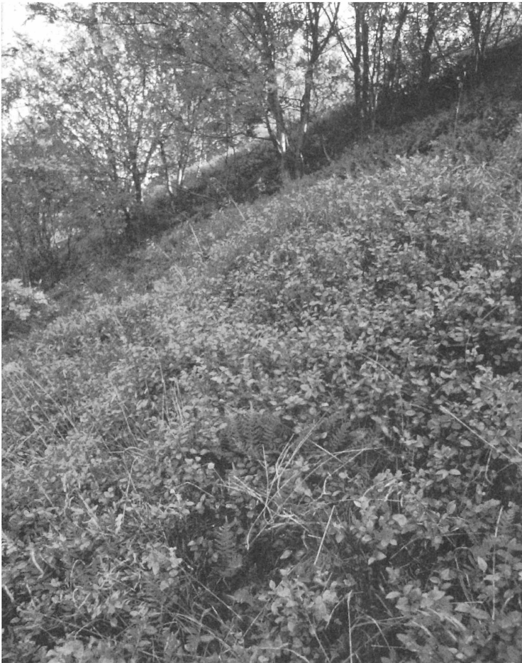
Schattig-luffeuchter Nordhang eines dithmarscher Kliffs mit rudimentär entwickeltem Vaccinio-Callunetum ; 10. 1992 NSG Kleve bei St. Michaelisdonn