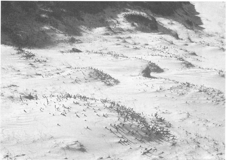
Hieracio-Empetretum ; initiale Wiederbesiedlung durch Empetrum nigrum nach Überwehung; 4. 1984, Hörnum, Sylt