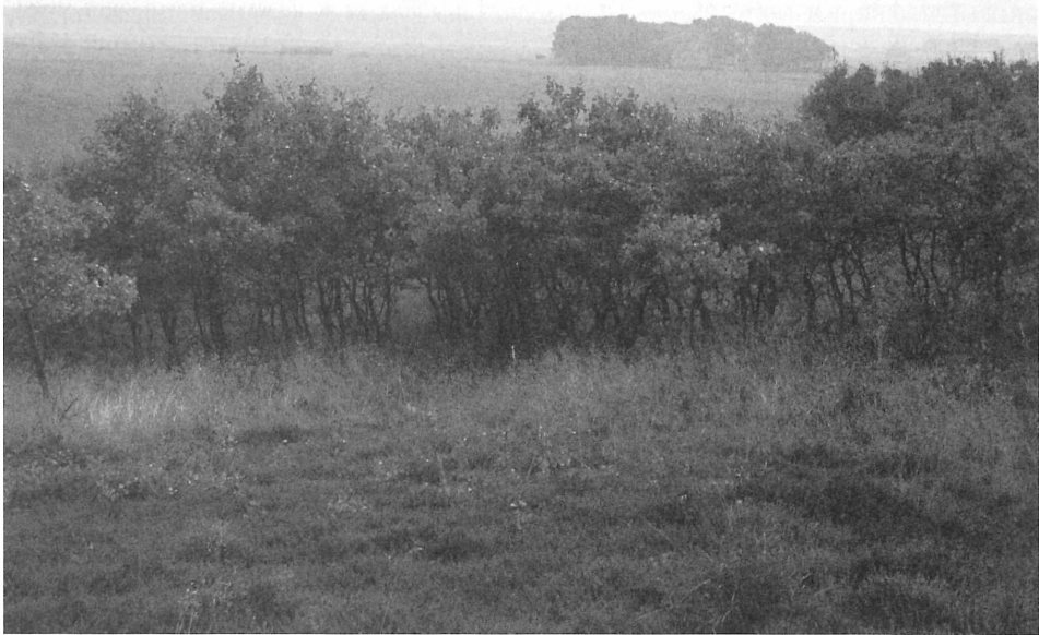
Deschampsia flexuosa -Stadium des Genisto-Callunetum auf einer angelner Binnendüne; 9. 1992, NSG Düne am Treßsee