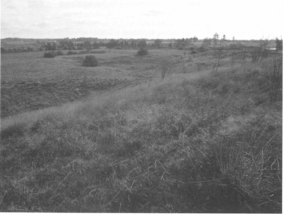
Empetrum nigrum -Stadium des Genisto-Callunetum auf einer Binnendüne in Nordfriesland, im Hintergrund ein Populus tremula -Vorwald des Betulo-Quercetum ; 9. 1983, NSG Süderlügumer Binnendünen