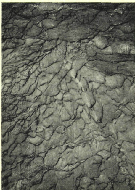
Abb. 2. Von der Gesteinsschichtung abhängige Deckenfazetten aus der jüngeren Bildungsphase der Egelhöhle

Das Problem der Speläogenese in der Triaszone muß noch mit weiteren systematischen Untersuchungen der alten Landoberfläche und Stockwerkgliederung der Gebirge sowie jungen tektonischen Bewegungen im Drauzug verknüpft werden, um eine genetische Klassifikation der Höhlen Kärntens vornehmen zu können. Es ist eine grundsätzliche,