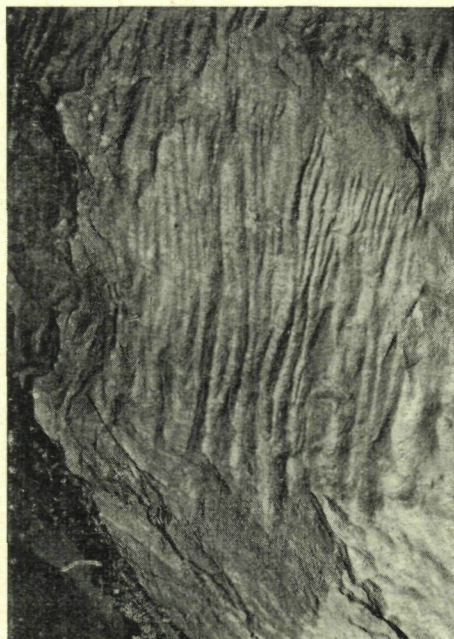
Abb. 1. Höhlenrillenkarren an den Laugflächen des Wettersteinkalkes der Egelhöhle in der Spitzegelgruppe, Gailtaler Alpen

Um eine aktive Wasserhöhle handelt es sich bei der Drautaler Plasnikhöhle am Gupf. Im Gebiet von Federaun bietet sich das Bei-