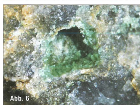
Abb. 3: Tetraedrit mit Spuren von Malachit; Bildbreite 10 mm.