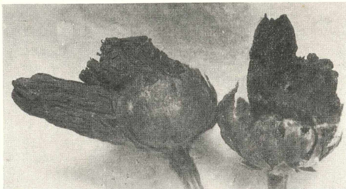
Abb. 1: Gallen von Rhopalomyia tanaceticola (KARSCH) an Blütenköpfchen von T. vulgare L.

verwachsene Rhopalomyia -Gallen. Die folgende Tabelle gibt eine Übersicht über die Zahl der Gallen pro Blütenköpfchen.