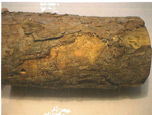
Abb. 2: Schlupflöcher von Monochamus galloprovincialis pistor (links unten, kreisrund), von Megopis scabricornis (rechts oben, oval).