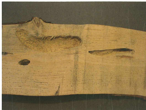
Abb. 3: Links, die angeschnittene, hakenförmige Puppenwiege von Megopis scabricornis , rechts, die angeschnittene, gangförmige Puppenwiege von Monochamus galloprovincialis pistor mit Ausgang.

Aufgrund der Generationsdauer des Körnerbocks (mindestens 3 Jahre), dem beschriebenen Alter des Kiefernholzes und dem Fraßbild der Larve (Abb. 2) scheidet ein Befall durch Eiablage aus. In der Abbildung auf der 4. Umschlagseite (unten) ist erkennbar, dass außer dem Anfertigen der Puppenwiege und des Ausganges keine weiteren Aktivitäten der Megopis -Larve vorliegen.