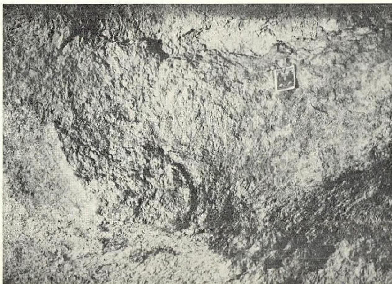
Abb. 1: Höhlenwand im Lichte einer Karbidlampe (Elfenhöhle bei Pfaffstätten, Katasternummer 1914/7)

Häufig besuchte Höhlen sind meist stark durch Ruß verschmutzt, wodurch interessante Fluoreszenzunterschiede verdeckt werden.