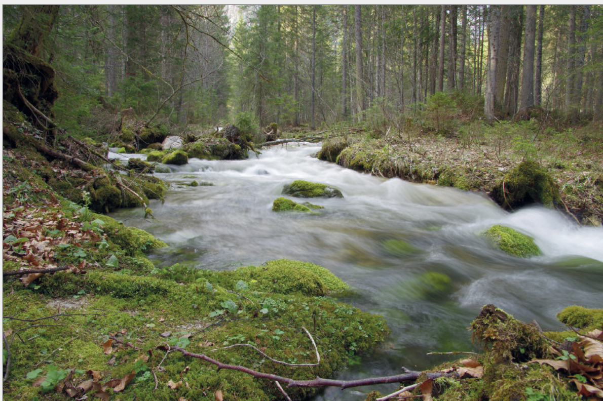
Abb. 1: Der naturbelassene Lauf des Sagtümpelbaches kurz vor dem Tauplitzter Wasserfall. Fig. 1: The pristine stream of Sagtümpelbach just before Tauplitzter Waterfall.