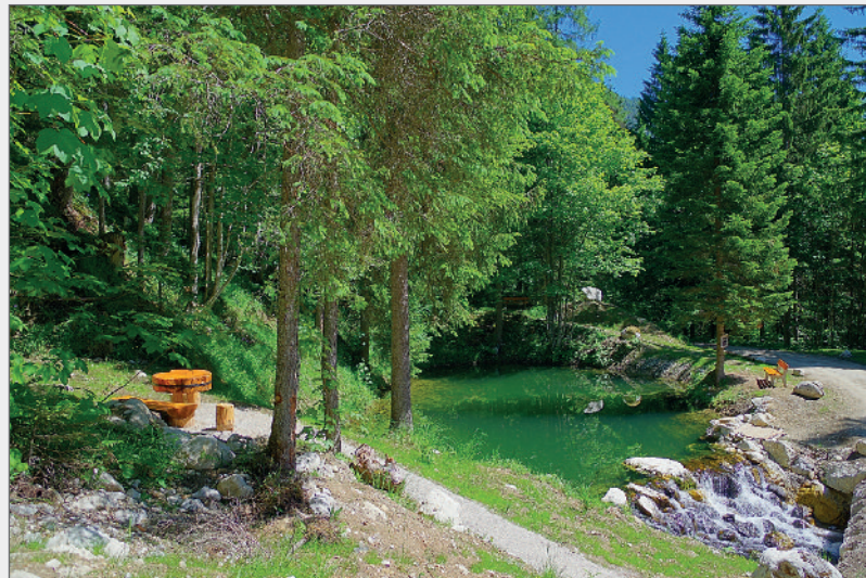
Abb. 15: Im Bereich um den Quelltopf wurden mehrere Sitzgelegenheiten und zwei Tische aufgestellt. Fig. 15: Several seats and two tables were installed next to the spring pot.

Dank ausgesprochen werden soll. Schlussendlich wurden noch insgesamt sechs großformatige Informationstafeln und mehrere Wegweiser aufgestellt. Nach der Fertigstellung dieser Arbeiten konnte der renaturierte Sagtümpel am 22.10.2017 feierlich eröffnet werden, wofür sich trotz schlechten Wetters rund 100 Personen vor Ort einfanden. Sehr erfreulich ist weiters die Auszeichnung des Projekts mit dem europäischen Höhlen- und Karstschutzpreis der Fédération Spéléologique Européenne (FSE).