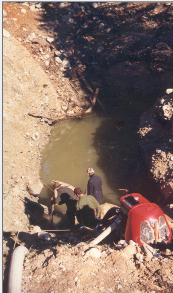
Abb. 8: Erste Bauarbeiten im teilweise trockengelegten Quelltopf des Sagtümpels im Jahre 1975.

„Dazu wurde in der Mitte des Sagtümpels ein Quellschacht ca. 3 x 3 m auf die Kote 972,25 niedergebracht und die Wände bis in eine Höhe von ca. 2,5 m mit Drainagerohren DM 10 cm wasserdurchlässig gestaltet. Der Arbeitsraum wurde mit Grobschotter bis auf Kote 976,37 hinterfüllt und darauf liegt eine wasserdichte Stahlbetonplatte (d = 30 cm), die über ihren gesamten