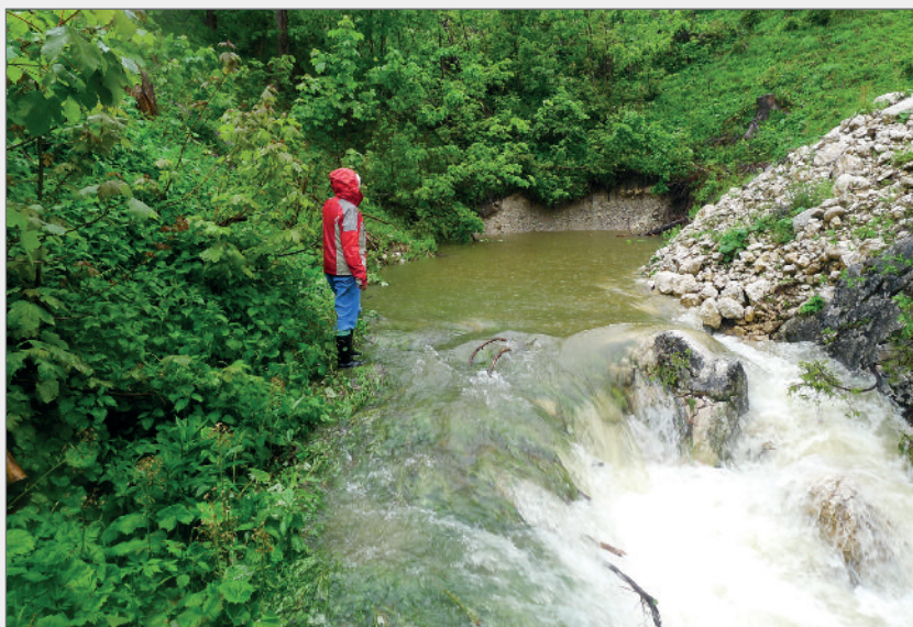
Abb. 5: Der höchste Austritt des Tiefenbaches bei einer extremen Hochwassersituation am 1. Juni 2013.

Im Zuge des Tauplitzalm-Forschungsprojekts konnten zusätzlich 14 Klein-, zwei Mittel- und zwei Großhöhlen entdeckt, erforscht und in den Höhlenkataster aufge-