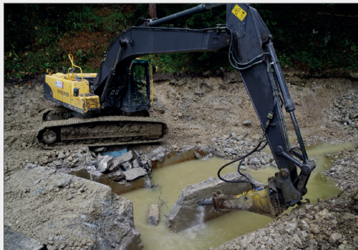
Abb. 12: Abbruch der Quellkammer mit einem schweren Hydraulikhammer. Fig. 12: Demolition of the source chamber using a heavy hydraulic hammer.

verankert war. Sämtliche Betonteile wurden aussortiert, auf LKWs verladen und in den am Pötschenpaß gelegenen Steinbruch der Firma Stummer transportiert. Dort erfolgte die Trennung von Beton und Baustahl für eine spätere Wiederverwertung.