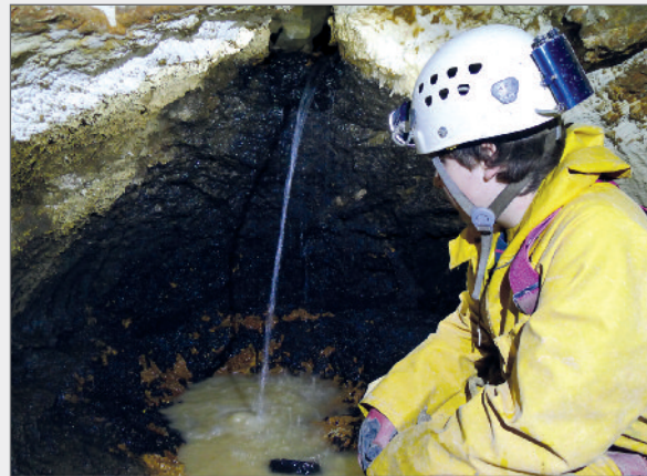
Abb. 6: In der Bullenhöhle tritt in 90 m Tiefe das erste Gerinne ein.

Im Jänner 2014 konnte diese sehr nahe am Parkplatz der Tauplitz-Alpenstraße gelegene Höhle entdeckt werden. Zahlreiche Forschungstouren ließen das Objekt rasch zur tiefsten Höhle des Tauplitzalm-Plateaus und der gesamten Teilgruppe 1622 anwachsen. Dazu mussten mehrere Verstürze ausgeräumt und zahlreiche Engstellen überwunden werden. Zurzeit weist die Bullenhöhle eine Länge von 591 m bei 182 m Tiefe auf. Die deutliche Wetterführung und die große erreichte Tiefe nähren die Hoffnung, über diese Höhle tatsächlich in den Hauptsammler des Tauplitzalm-Aquifers vordringen zu können. Beim Gerinne der Bul-