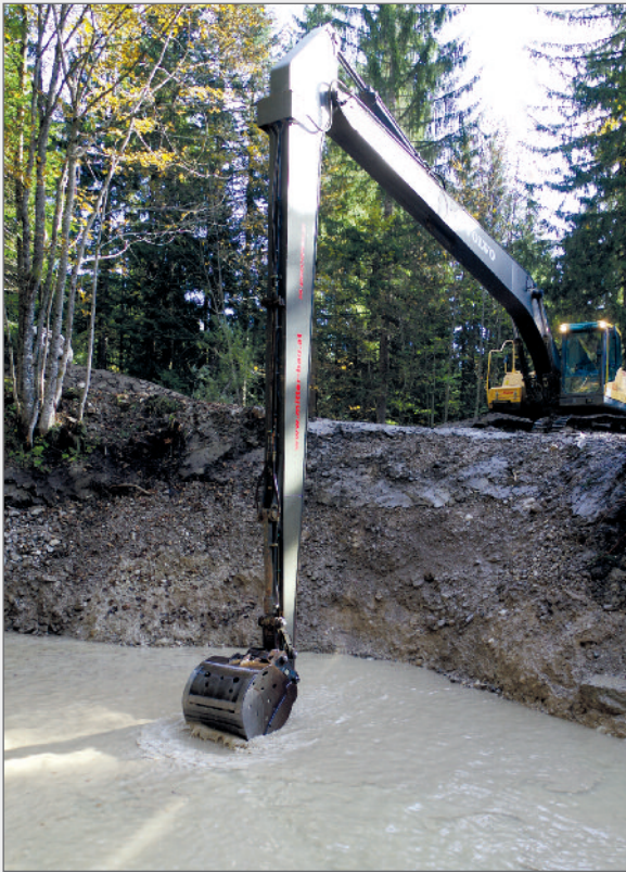
Abb. 13: Mit dem Spezialbagger wurde der Quelltopf bis in 10 m Tiefe freigelegt. Fig. 13: The source pot was re-exposed to a depth of 10 m using a special excavator.

te der Quelltopf erstmals wieder auf die geplante Spiegelhöhe gefüllt werden. Am Abend des 8.12.2016 floss zum ersten Mal Wasser über den fertigen neuen Überlauf des Quelltopfes. Das Ansaugrohr sowie die Wasserleitung blieben für etwaige Nutzung des Wassers erhalten. Weiters blieben der Grundablassschacht und das Grundabflussrohr bestehen, um den Wasserspiegel des Quelltopfes für Wartungsarbeiten oder wissenschaftliche Untersuchungen bei Niedrigwasser um fast 5 m absenken zu können. Insgesamt war es notwendig, im Zuge der Renaturierung an die 1500 m 3 Material aus dem Quelltopf zu entfernen und abzutransportieren.