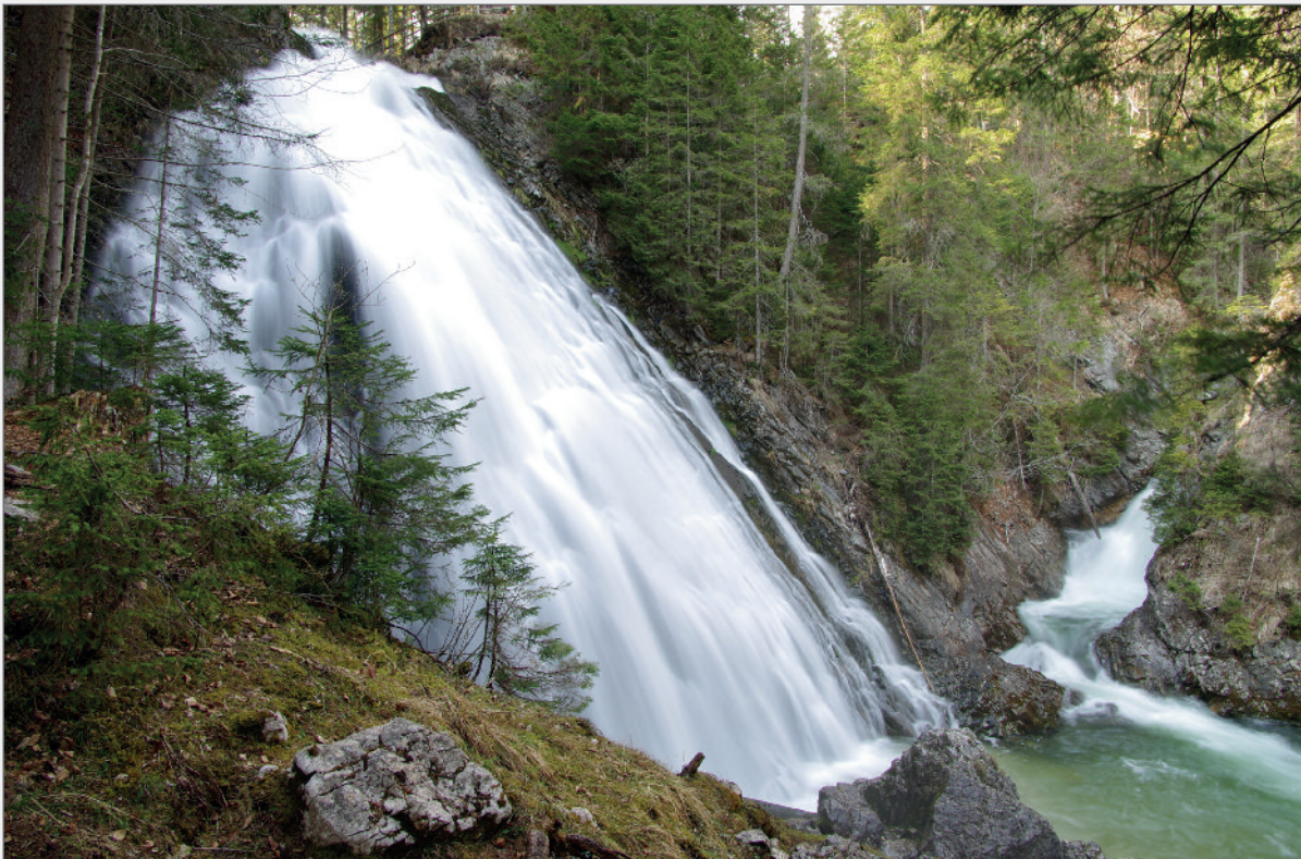
Abb. 2: Der 30 m hohe Tauplitzter Wasserfall ergießt sich direkt in den Grimmingbach. Fig. 2: The 30 m-high Tauplitzter Waterfall flows directly into Grimmingbach.