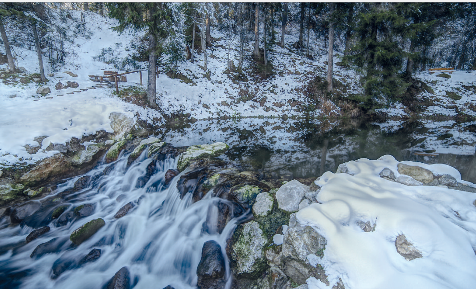
Abb. 16: Abfluss des renaturierten Sagtümpels im November 2017. Fig. 16: Outflow of Sagtümpel in November 2017.