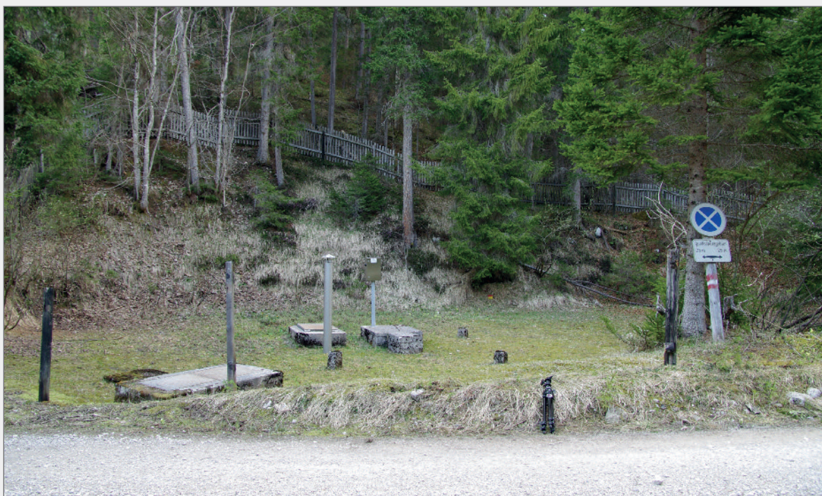
Abb. 9: Situation der Quellfassungsanlage vor Projektbeginn.