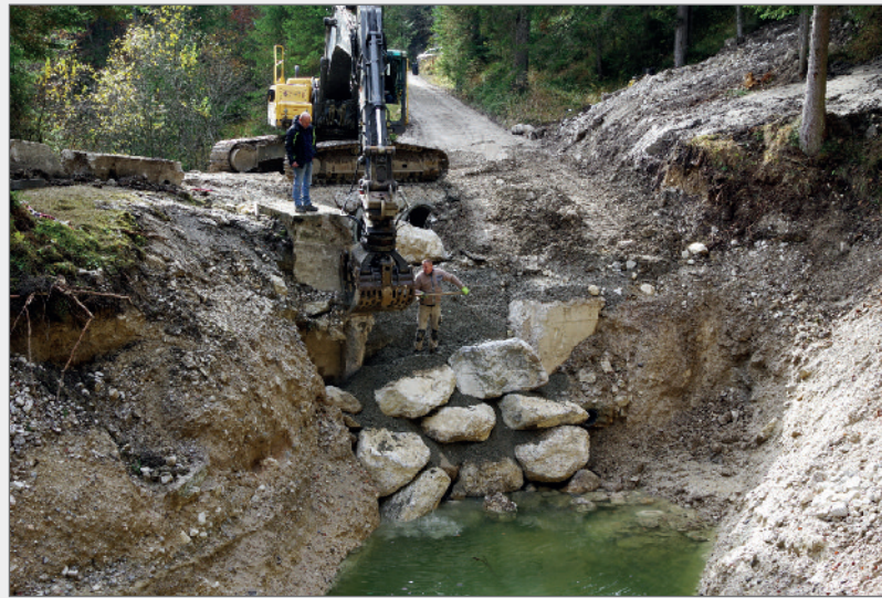
Abb. 14: Für den neuen Überlauf des Quelltopfes musste eine Steinschichtung mit Betonhinterfüllung aufgebaut werden. Fig. 14: A stone dressing with concrete backfilling was made for the new overflow of the spring pot.

Neben der Neuanlage und Verbesserung von Gehwegen entstanden im näheren Umfeld auch zwei Biotope für Amphibien. Das Gelände wurde leicht angepasst, mit Humus bedeckt und begrünt. Mehrere Geländer, Sitzgelegenheiten, ein Brunnen sowie ein Tisch aus einem Mühlstein runden die Anlage ab (Abb. 15). Hierbei handelte es sich vorwiegend um Sachspenden von Privatpersonen aus Tauplitz, wofür hier nochmals der