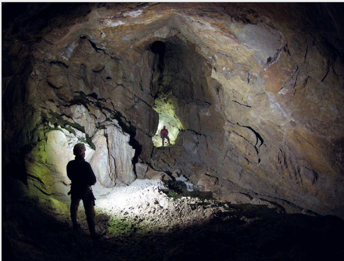
Abb. 7: In der Hochklammhöhle herrschen großräumige Gangabschnitte vor. Fig. 7: Spacious passages prevail in Hochklammhöhle.