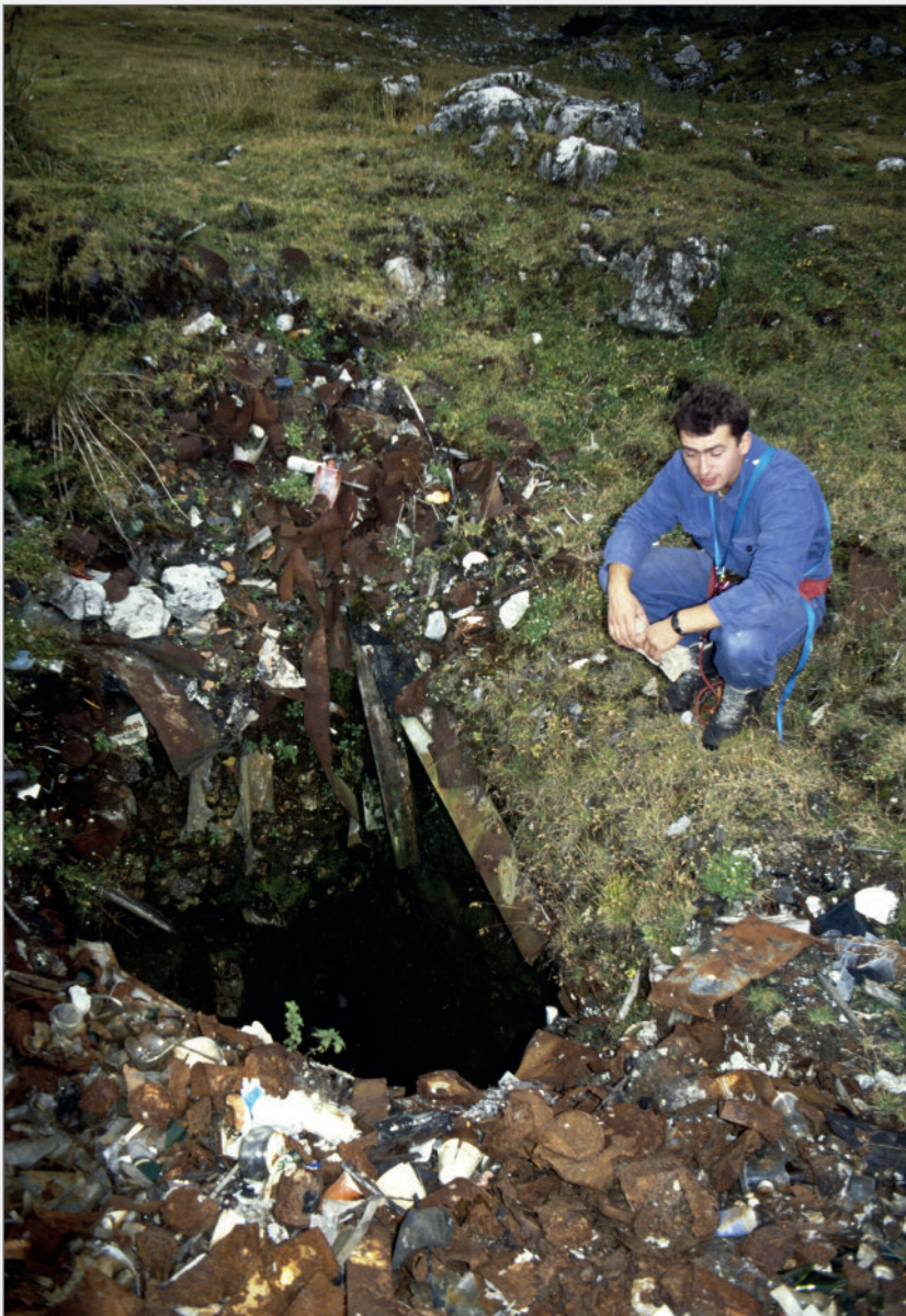
Abb. 4: Ein fast vollständig mit Unrat verfüllter Schacht im Bereich des Hemmernbodens im Jahre 1990.

Grafikgrundlage/Background Österr. Karte 1:50.000 aus SPELIX; Zeichnung/drawing: Robert Seebacher