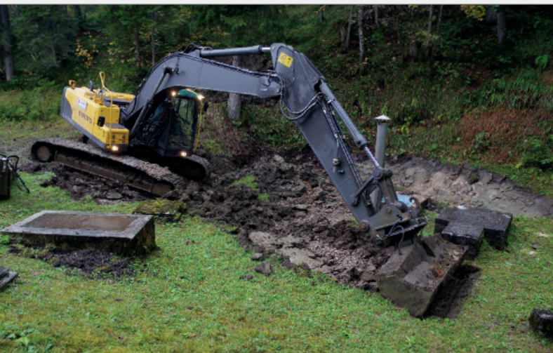
Abb. 11: Beginn der Renaturierungsarbeiten am 4.10.2016. Freilegung der Stahlbetondecke. Fig. 11: The beginning of the renaturation on October 4, 2016 and exposure of the concrete ceiling.