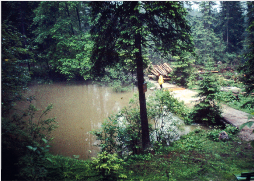
Abb. 10: Die Quelle im Juni 1973 während eines mittleren Hochwassers.

Fig. 10: The spring in June 1973 during moderate flooding.