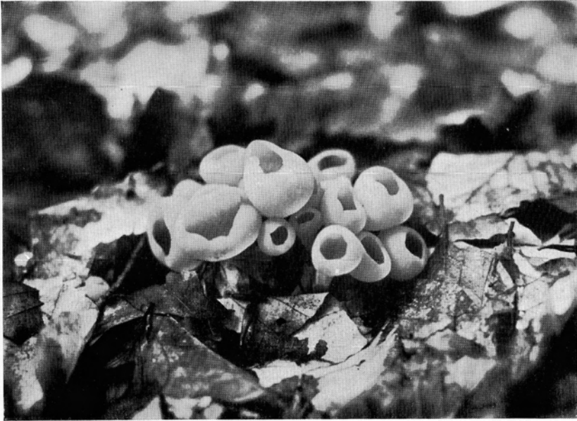
Bild 3. Dicht gedrängte, noch nicht voll entwickelte Becher des Rheinischen Schüsselpilzes ( Aleuria rhenana Fockel) im Buchen-Fallaub; \frac{2}{3} nat. Gr. Klosterwald bei Wetzlar, 31. August 1941.