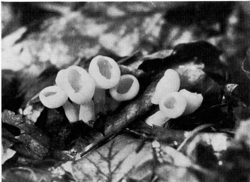
Bild 2. Junge, noch mäßig geöffnete Fruchtkörper des Rheinischen Schüsselpilzes ( Aleuria rhenana Fuckel) mit kräftigen Stielen; \frac{1}{4} nat. Gr. — Aufn. Verf., Klosterwald bei Wetzlar, 31. August 1941.