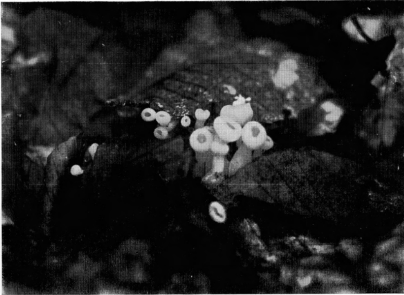
Bild 1. Ganz junge, aus Buchen-Fallaub hervorbrechende Rheinische Schüsselpilze ( Aleuria rhenana Fuckel); \frac{1}{4} nat. Gr. — Aufn. Verf., Klosterwald bei Wetzlar, 31. August 1941.