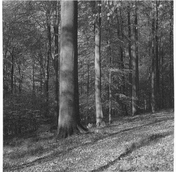
Abb. 1: Alter Buchenwald, naturgemäß bewirtschaftet; seit 15 Jahren als Naturwaldreservat von jeder weiteren Nutzung ausgenommen.

Vögel sind vergleichsweise einfach zu beobachten. Sie eignen sich besonders gut als Indikatoren für den Artenreichtum eines Lebensraumes. Junge Wälder sind der Lebensraum bodenbrütender Vogelarten, etwa des Baumpiepers und der Buschbewohner, zum Beispiel Mönchsgrasmücke, Gartengrasmücke, Heckenbraunelle. Es handelt sich dabei überwiegend um häufige Allerwärtsarten, deren Bestand nicht gefährdet ist. Am ärmsten sowohl an Vogelarten wie an Vögeln schlechthin sind Stangenhölzer.