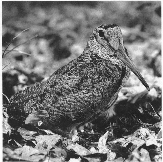
Abb. 8: In solchen Laubwaldparadiesen wie (6) lebt die geheimnisvolle Waldschnepfe, eine Rote-Listen-Art, die nach wie vor bejagt wird.

Auch das unsinnige Abknallen von Eichelhähern ist überholt. Vor mehr als 50 Jahren schon hatte der berühm-