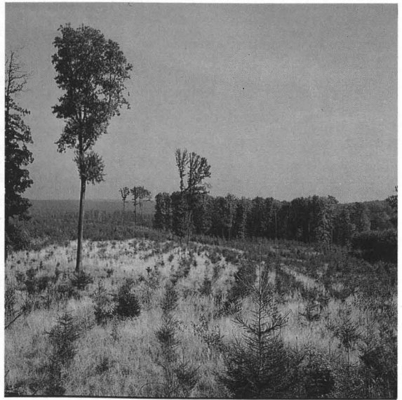
Abb. 3: Nach wie vor bundesdeutsche Waldrealität: Kahlschlag in natürlichem Buchenwald mit nachfolgender Nadelholzmonokultur.

„Der Wald wird zum Forst. Auf weiten Flächen werden so die ursprünglichen Mischwaldbestände durch reine gleichaltrige Bestände, Monokulturen abgelöst. Schlag reiht sich an Schlag. Sturm und Waldschädlinge setzen mit ihrem Wirken ein. Man hört von Katastrophen, die den neuen Forst heimsuchen“ (Dannecker 1950).