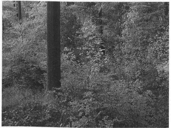
Abb. 6: Üppige natürliche Verjüngung von 14 verschiedenen Laubbaumarten unter dem schützenden Schirm des vorsichtig aufgelockerten Altbestandes.

Dem Ideengut und den Organisationen des Naturschutzes gegenüber war die ANW seit jeher aufgeschlossen; die bayerische Landesgruppe hat den Biotop- und Artenschutz sogar in ihre satzungsgemäßen Aufgaben übernommen.