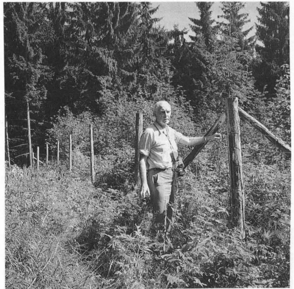
Abb. 7: Die Überhege von Hirsch und Reh verhindert naturgemäße Waldwirtschaft. Seit Jahrzehnten ist ordnungsgemäße Forstwirtschaft nur hinter Schutzzäunen möglich. Prof. Bernhard Grzimek hatte schon vor 20 Jahren auf diese gesetzwidrigen Übelstände aufmerksam gemacht.

Eines hat sich geändert: Eine breite Öffentlichkeit ist über die Problematik besser aufgeklärt, das Waldsterben von oben hat auch den Blick auf das verbißbedingte Waldsterben von unten gelenkt. Die Jagd ist in der Defensive.