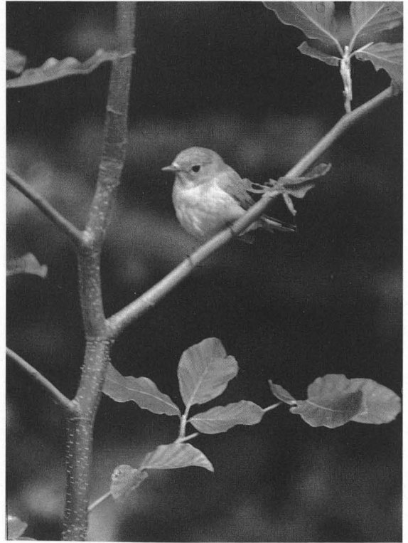
Abb. 2: Zwergschnäpper, die seltenste einheimische Schnäpperart. Bewohnt solch reich strukturierte alte Buchenwälder wie (1).

Das Alter überwiegt, im Hinblick auf den Artenreichtum, die Bedeutung der Baumartenmischung. So ist ein