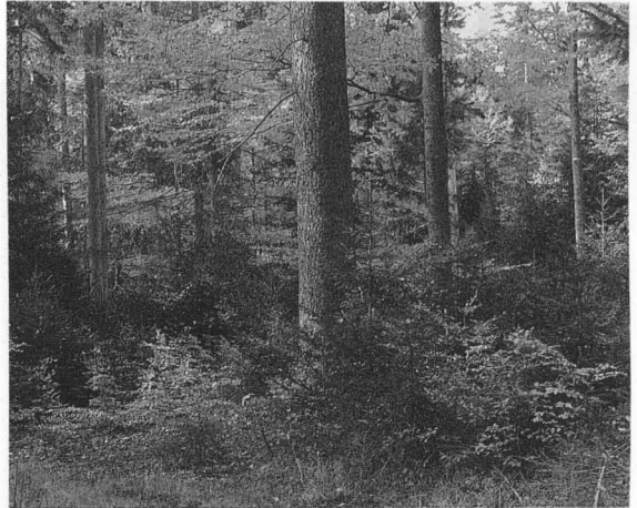
Abb. 4: Ein bäuerlicher Plenterwald aus Fichte, Tanne und Buche. Die stabilste Waldstruktur, die zugleich nahezu allen Wünschen des Biotop- und Artenschutzes entspricht. Von diesem Idealwald her hat Karl Gayer seine Lehre vom gemischten und ungleichaltrigen Wald entwickelt.

In der Bundesrepublik gibt es nur kleine Restflächen, wo traditionell geplentert wird. Meist sind es bäuerliche Wälder am Alpenrand, im Schwarzwald und im Bayerischen Wald. Doch es gibt eine Gruppierung von Waldbesitzern und Forstleuten, die konsequent das Erbe Gayers und Möllers wahren und naturgemäßer Waldformen und dem Plenterprinzip zuneigen.