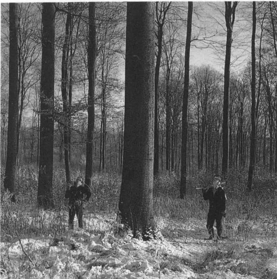
Abb. 5: Bei naturgemäßem Waldbau werden erntereife Bäume nicht „schlagweise“ sondern einzeln genutzt.

Der unergiebigsten Auseinandersetzungen müde zogen sich die Mitglieder der ANW schließlich in den Wald zurück, um dort an Beispielsbetrieben in unverdrossener Arbeit ihre Ideen zu realisieren und weiterzuentwickeln. Bei jährlichen Arbeitstagen wurden die Ergebnisse der praktischen Arbeit kritisch überprüft und die Fortentwicklung diskutiert.