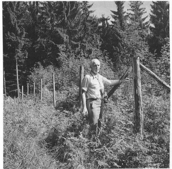
Abb. 7: Die Überhege von Hirsch und Reh verhindert naturgemäße Waldwirtschaft. Seit Jahrzehnten ist ordnungsgemäße Forstwirtschaft nur hinter Schutzzäunen möglich. Prof. Bernhard Grzimek hatte schon vor 20 Jahren auf diese gesetzwidrigen Übelstände aufmerksam gemacht.

Eines hat sich geändert: Eine breite Öffentlichkeit ist über die Problematik besser aufgeklärt, das Waldsterben von oben hat auch den Blick auf das verbißbedingte Waldsterben von unten gelenkt. Die Jagd ist in der Defensive.