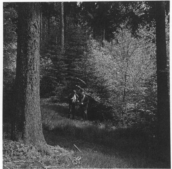
Abb. 10: Auch naturwidrige Fichten-Kunstforste lassen sich durch vorsichtiges Auflichten und durch Unterbau mit Laubbäumen und Tannen zu stabilen, ungleichaltrigen Mischwäldern umbauen.

Längst haben Forstverwaltungen erkannt, daß der ihnen anvertraute Wald in einer kaputten Umwelt zur Arche Noah geworden ist. Es gibt erfreuliche Beispiele dafür, wie ernst Forstleute Naturschutz nehmen können. Naturwaldreservate, wie sie bereits 1934 der Forstmann Hesmer gefordert hatte, schützen allein in Bayerns Staatsforsten über 4.000 ha wertvolle Reste naturnaher Wälder vor weiteren Eingriffen. Feuchtgebiete werden erhalten und neue gestaltet. Trockenrasen bleiben vor Aufforstung verschont und werden gepflegt. Höhlen- und Horstbäume werden sorgsam erhalten. Für seltene Baum- und Straucharten wie Speierling, Elsbeere, Wildbirne und Eibe oder die verschiedenen Wildrosen gibt es eigene Schutz- und Nachzuchtprogramme in Bayern. Insektenfreundliche Weichlaubhölzer dürfen künftig wieder — und nicht nur an Wegrändern — wachsen. Der forstliche Vogelschutz entwickelt sich weg von der einseitigen Hege nistkastenbewohnender „Arbeitsvögel“ und kümmert sich um Spechte, Greifvögel und Hohltauben. Auch erste An-