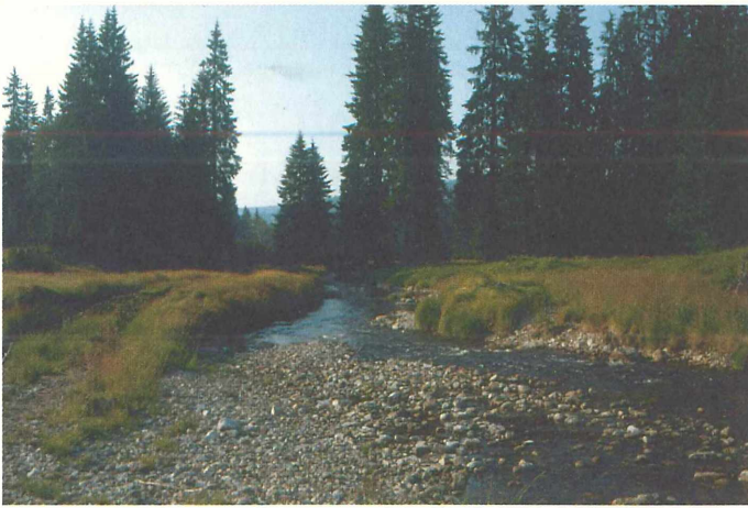
Abbildung 4/1 und 4/2

Pflege und Management werden wir uns in Zukunft nicht mehr unbegrenzt leisten können. Schon daraus ergibt sich ein Plädoyer für natürliche Dynamik, die nichts kostet, sobald die dafür nötigen Flächen einmal bereitgestellt sind. Ökologisch werden sie dauerhaft ein „Rendite“ abwerfen, weil die Natur hier ständig gestaltet und bereichert. Beispiele: ein ungebändigter Oberlauf im Böhmerwald (mit geringer Überflutung) und ein großflächiges deichfreies Überflutungsgebiet eines Böhmerwald Abflusses im Unterlauf (Regentalae).