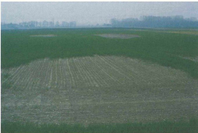
Abbildung 4/4 und 4/5

Auch manche Hinterlassenschaften menschlicher Nutzung und Technik sind heute Kapital im Naturschutz, das es zu sichern und nicht wegzuräumen gilt (alter Bahnkörper im Kellerwald/Hessen und Ruderalflur in Steinbruch bei Karlstadt).