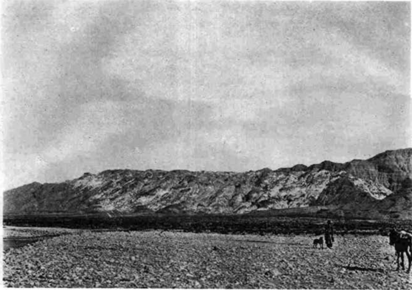
1. Kuh-i-Namak, nō. von Ginao am Persischen Golf. Weiss: Salz, dunkler: Eozän-bis Miozänkalk.