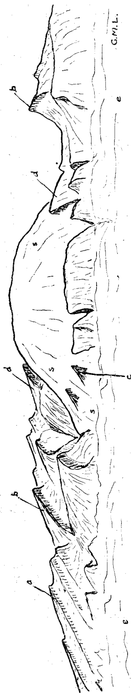
Abb. 1. Kuh-i-Namak (Dahlistan).

a = Pliozän und Miozän; b = Eozänkalk; c und d = Kreidekalk; e = Alluvium der Ebene; s = Steinsalz.