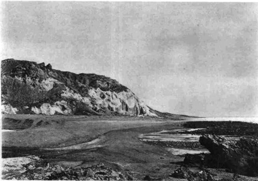
2. Salzaufbruch von Oishm, Persischer Golf. Links oben Blöcke von kambrischem Dolomit.