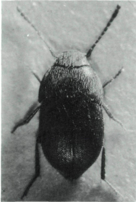
Abb. 1: Leptinus testaceus MÜLLER.