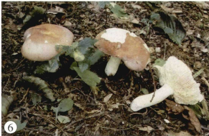
Abb. 4. Russula carminipes (PA R1892). – Abb. 5. Russula carminipes (PA R1090). – Abb. 6. Russula sericatula (PA R2222). – Phot. H. PIDLICH-AIGNER.