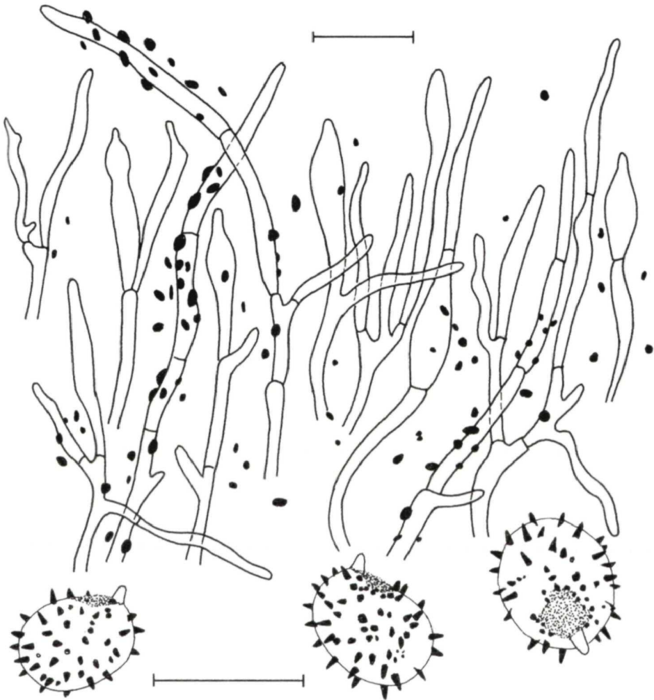
Abb. 3. Russula sericatula . Huthautelemente (PA R2163) und Sporen (PA R2222). – Maß: Huthautelemente 20 \mu\text{m} , Sporen 10 \mu\text{m} .

Hymenialzystiden: 65-95 \times 6-11 \mu\text{m} , schmal spindelig, meist apikal mit wurmförmigem Fortsatz.