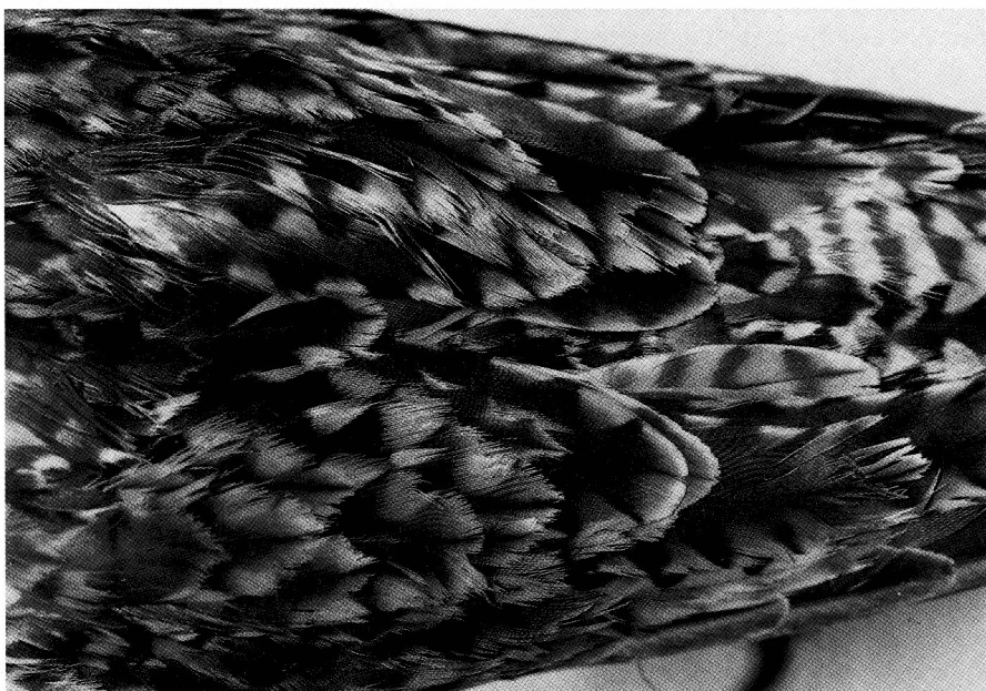
Abb. 2 Schirm- und Armschwingen des Eskimo-Brachvogels, „Weibchen“, ausgefranster Rand: alte Federn, glatter Rand: neue Federn.

Die beiden Eskimo-Brachvögel im Museum am Schölerberg – Natur und Umwelt in Osnabrück sind in „natürlicher“ Position präpariert (Abb. 1); die Flügel sind an den Körper geklebt. Entsprechend den Alterskriterien nach PRATER et al. (1977) und HAYMAN et al. (1986) sowie der Ansicht von J. MARCHANT (Schriftliche Mitteilung) handelt es sich bei beiden Exemplaren um adulte Vögel. Wahrscheinlich sind es ein Männchen und ein Weibchen, wie aufgrund der unterschiedlichen Größe angenommen werden kann. Beim „Weibchen“ sind die Schirm- und Schulterfedern mit den Adult-Merkmalen nur ein wenig abgetragen; zwischen ihnen befinden sich aber deutlich sichtbar frisch gemauerte Federn mit glatterm Rand (Abb. 2). Die Mantelfedern und die Flügeldecken sind stark abgetragen, die Handschwingen dagegen in relativ frischem Zustand. Auch beim „Männchen“ ist dieselbe Abnutzung am Gefieder zu erkennen. Daher kann angenommen werden, daß die beiden Eskimo-Brachvögel höchst wahrscheinlich im Frühjahr erlegt worden sind. Es kann aber nicht ausge-