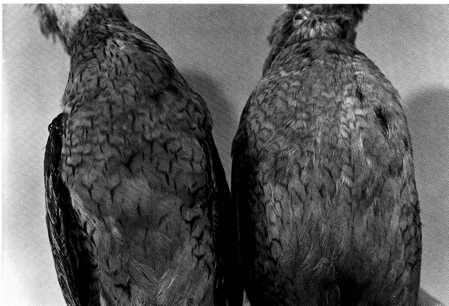
Abb. 3 Brustgefieder des Eskimo-Brachvogels links „Weibchen“ mit deutlichem Y-Muster rechts „Männchen“ mit leichter Sperberung im Kehlbereich.

schlossen werden, daß die beiden Vögel im Spätherbst gesammelt wurden, da die Mauser-Muster und die morphologische Variation dieser Art nur sehr wenig bekannt sind.