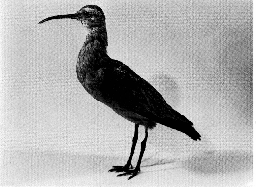
Abb. 1 Eskimo-Brachvogel ( Numenius borealis ), „Weibchen“, Totalansicht.

Der zimtfarbene Eskimo-Brachvogel ist eine mittelgroße Watvogelart aus der Familie Scolopacidae. Diese Art wird seit Jahrzehnten als extrem gefährdet angesehen und ist vom Aussterben bedroht. Obwohl die exakten Gründe für den rapiden Rückgang der Population dieses ursprünglich häufigen arktischen Vogels unklar sind, so ist doch klar, daß menschliche Aktivitäten wie Jagd während des Vogelzuges entlang Amerikas Küste nach Patagonien oder Lebensraumveränderungen zur Dezimierung beigetragen haben.