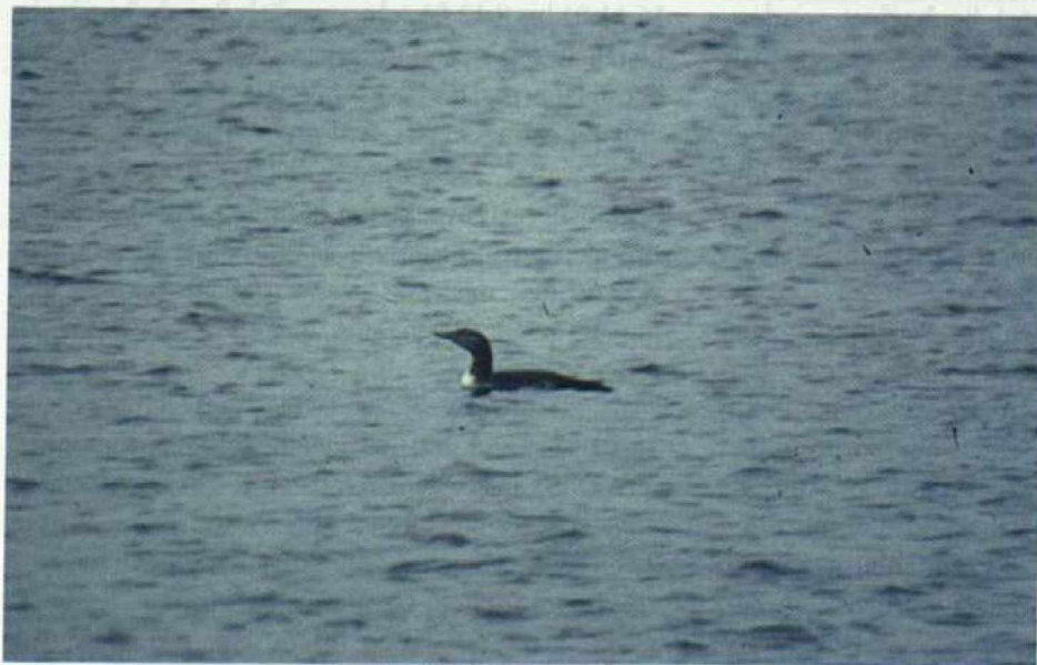
Abb. 1: Belegaufnahme des juvenilen Gelbschnabeltauchers vom 4.11.01 bei bedecktem Himmel.

Für mindesten 2 Wochen hatte der Vogel am Ostufer der Talsperre eine Bucht besetzt, die er