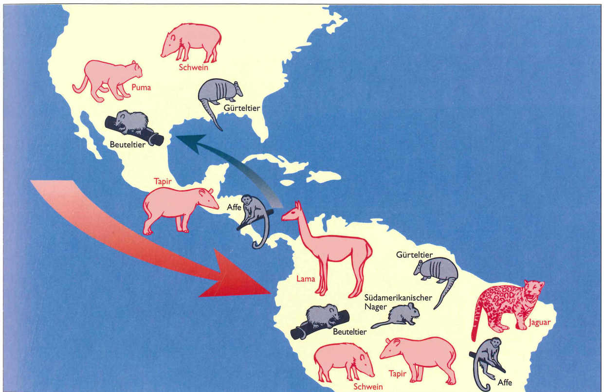
Abb. 63: Ab der Eiszeit (Pleistozän) ermöglichte die Panamabrücke Migrationen von Landtieren in beide Richtungen. Südamerikanische Riesengürteltiere und Riesengürteltiere drangen nach Norden vor. Die aus der Alten Welt stammenden Säugetiere erwiesen sich in den meisten Fällen als überlegen. In Nordamerika konnten sich Opossum und Gürteltier halten (nach THENIUS 1980). Grafik: K. Repp.

Dr. Herbert Summesberger Geologisch-Paläontologische Abteilung Naturhistorisches Museum Wien, Burgring 7, A-1014 Wien, Österreich