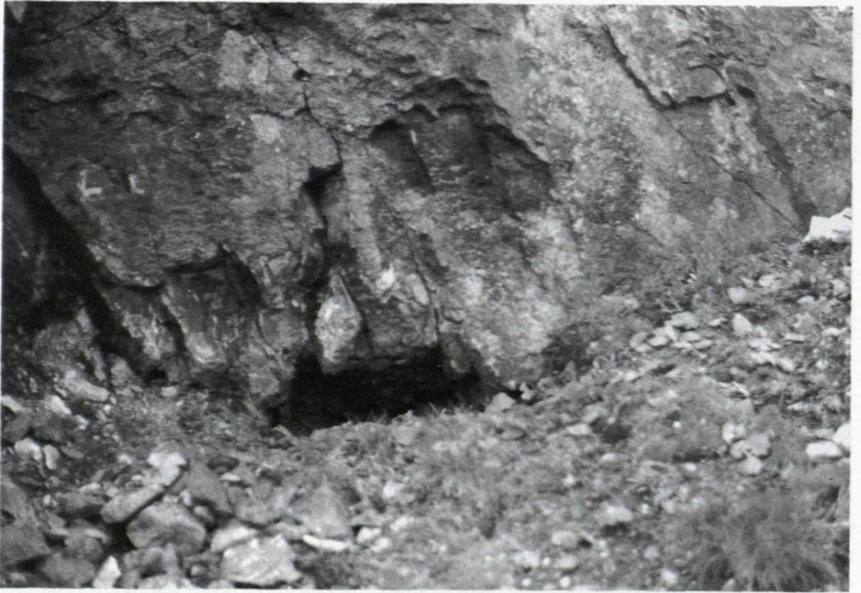
Das Knappenloch aus der Nähe.