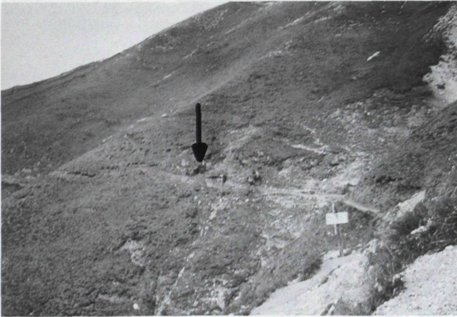
Erzausbisse am Weg von der Starkenburger Hütte zum Seejöchl. Der Pfeil zeigt zu einem Knappenloch.