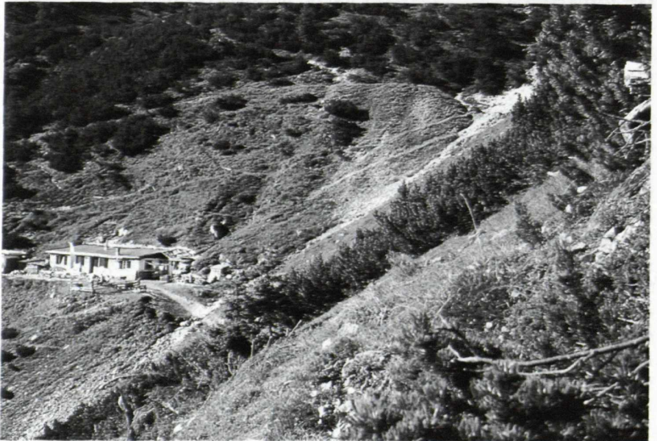
Die ehemalige, umgebaute Knappenhütte in 1830 Meter Höhe am Weg von Froneben zur Starkenburger Hütte. Ein Stollen liegt zwischen der Hütte und dem Bach, ein zweiter rund 25 Meter höher, im Bild rechts oben.