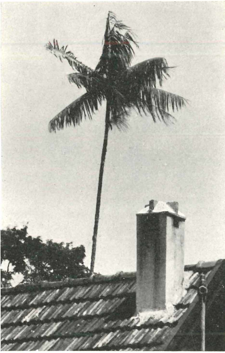
Abb. 1. Seglerschornstein im Itatiaia, zum Teil gegen den Einflug der Chaetura vergittert. Im Hintergrund eine Kohlpalme ( Euterpe edulis ).

durchschnittlich 8, im April 7 Chaetura . Die höchste an diesem Schornstein mit Sicherheit wahrgenommene Seglerzahl war 12. Zur richtigen Beurteilung dieser Zahlen müssen wir bedenken, daß der in einen Schornstein gehörige Familienverband, der nach Heranwachsen der Jungen noch eine Weile zusammenhält, normalerweise 5 bis 6 Segler (2 Eltern mit 3 bis 4 Kindern) umfaßt.