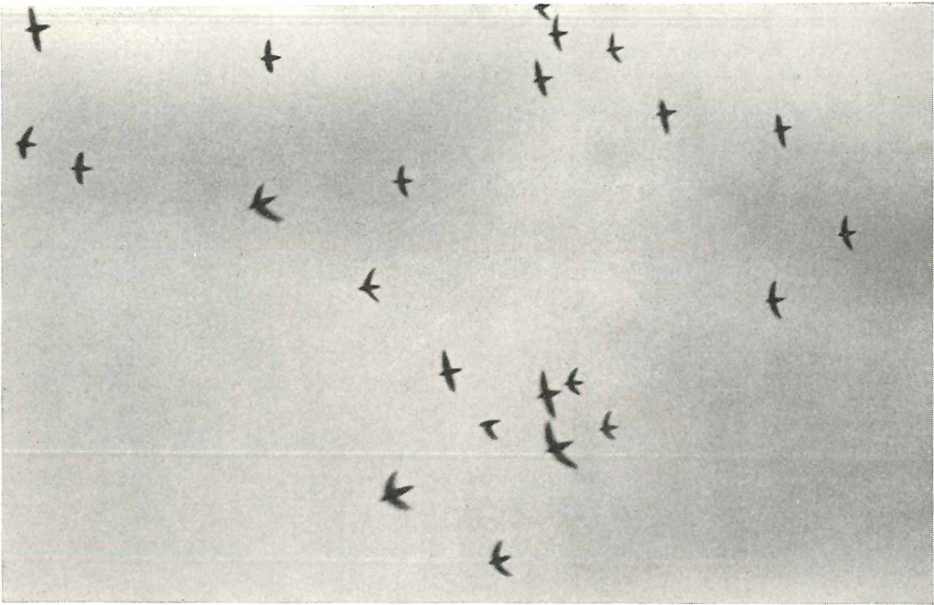
Abb. 3. Chaetura andrei , Ausschnitt aus einem Winterschwarm vor dem Einflug in den Schornstein Cartolano, 11. August 1951.

rückzukehren. Als „Sommer“ bezeichnet man hier die heiße, regenreiche Zeit von November bis April. Die Monate Mai bis August sind die kühlgsten, trockenen Monate, der „Winter“, September und Oktober sind Übergang. Daß man in einem subtropisch-tropischen Gebiet eigentlich nicht von Winter sprechen kann, erhellt aus der Tatsache, daß die mittlere Jahrestemperatur von Rio de Janeiro (Meereshöhe) bei +22,3^{\circ}\text{C} liegt, die Jahresschwankung nur etwa 6,5^{\circ} beträgt. (In Europa rechnet man mit einer Schwankung von 48^{\circ} . Die geringe Jahresamplitude wird in Brasilien zum Teil durch hohe Tagesschwankung wieder ausgeglichen.) Für