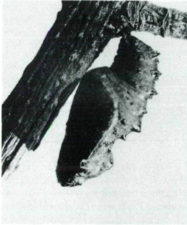
Abb. 2. Puppe von C. dia .

Die Aufzucht der Raupen brachte trotz Verabreichung von gewässertem Futter fast keine Verluste, wenn die Tiere ziemlich warm, z.B. tagsüber bei 27°C, gehalten wurden 1 . Die Larven zeigten dann eine rege Aktivität und verpuppten sich unter Langtagbedingungen – siehe die Dormanzuntersuchungen weiter unten – bereits nach gut 3 Wochen; bei Temperaturen zwischen ständig 28 und 31°C plus Dauerlicht nahm die Zucht ex ovo bis zur Verpuppung sogar nur 11-12 Tage in Anspruch. Hingegen fraßen zumal die Eiraupen bei Temperaturen deutlich unter 20°C sehr zögernd, und die Verluste waren hoch.