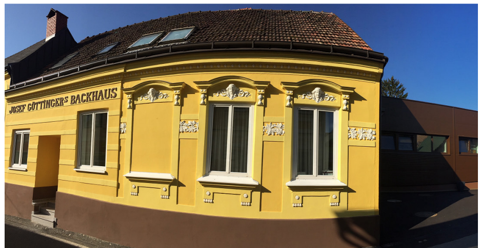
Firmengebäude Göttinger erlesene Patisserie