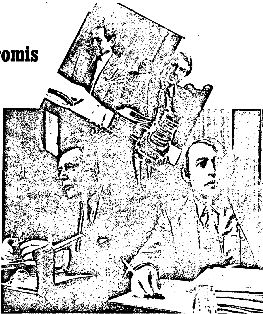
Bruxelles, 21 avril : Jacques Fouchier, secrétaire d'Etat à l'Agriculture, et le ministre, Pierre Méhaignerie. En médaillon, les Britanniques : Alick Buchanan-Smith et le ministre, Peter Walker.

Mais à la condition que la Grande-Bretagne fasse, aussi, un effort. La France, sur ce point, avait adopté une position extrêmement ferme. Pas question, notamment, d'aboutir à un accord sur la contribution britannique, pour se retrouver ensuite face à une