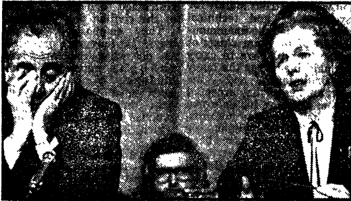
Heal the rift. Mrs Thatcher debates. Sr Cossiga of Italy broods

towards our net contributions deficit of £1,100m, this leaves an additional £800m or so to be covered (though she doesn't expect to achieve all of it).