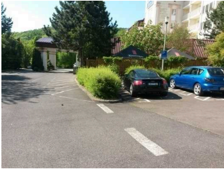
Weg ab Parkplatz zum Hoteleingang

Über den Weg sind zu erreichen: Eingangsbereich