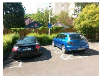
Parkplatz 3 und 4

Es ist ein allgemeiner Parkplatz vorhanden.