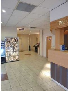
Weg zum Aufzug