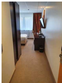
Eingang zum Zimmer