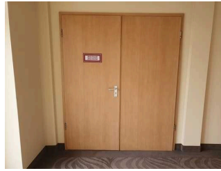
Tür zum Tagungsraum

Auf folgende zu nutzende Wege wird hingewiesen: Weg ab Rezeption zu Restaurant und Tagungsraum Jena