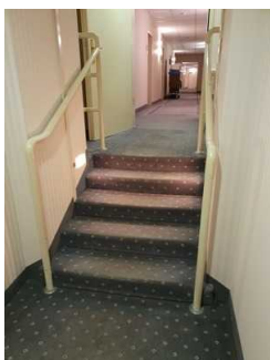
Treppe auf dem Weg zum Zimmer