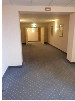
Weg zum Zimmer