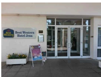
Eingangstür BEST WESTERN Hotel Jena