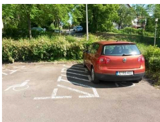
Parkplatz 1 und 2