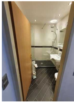
Tür zum Badezimmer

Der Sanitärraum gehört zu: Zimmer 447 - baugleiche Zimmer erreichbar mit Aufzug