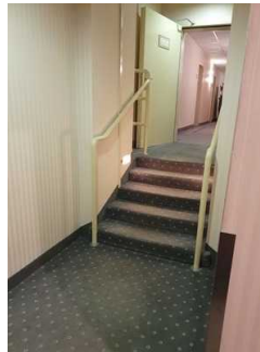
Treppe auf dem Weg zum Zimmer

Über den Flur / Weg / Durchgang sind zu erreichen: Zimmer 447 - baugleiche Zimmer erreichbar mit Aufzug