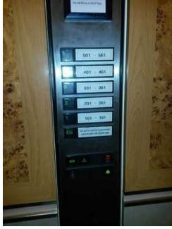
Tastatur im Aufzug