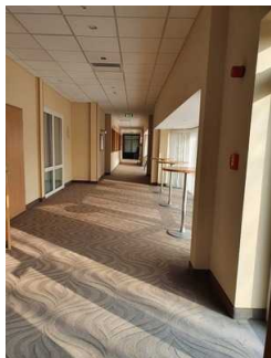
Weg zum Restaurant

Über den Flur / Weg / Durchgang sind zu erreichen: Frühstücksraum und Restaurant Erdgeschoss