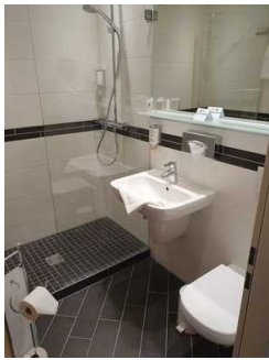
Waschbecken und Duschkabine