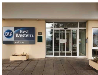
Eingangstür BEST WESTERN Hotel Jena

Auf folgende zu nutzende Wege wird hingewiesen: Weg vom Parkplatz zum Haupteingang