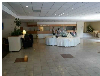
Hotel-Lobby mit Rezeption