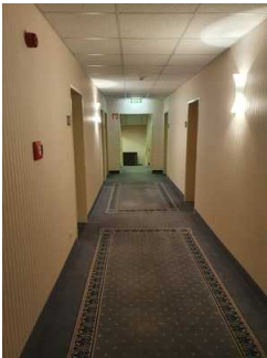
Weg zum Zimmer