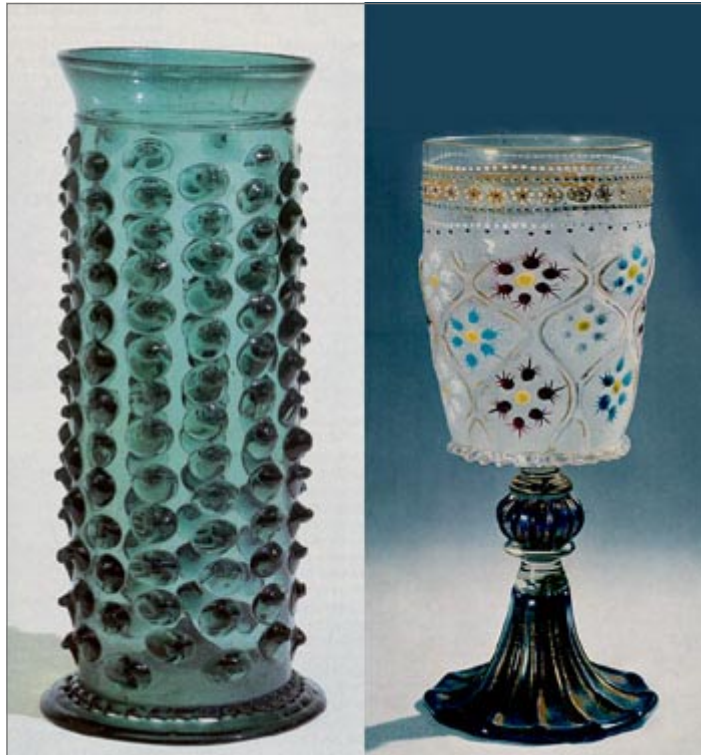
3 Stangenglas mit Nuppen, Deutschland oder Schweiz, Anfang 16. Jh. H. 29,2 cm. Historisches Museum Basel. Abbildung aus Baumgartner/Krueger, Phönix aus Sand und Asche , München 1988.

In Italien ging es zur gleichen Zeit offenbar sehr viel gesitteter und kultivierter zu. Das mag mit an der Geschichte des Landes und seiner im 6. Jahrhundert v. Chr. einsetzenden griechischen Kolonisation liegen, die auch »hellenisch Trinken« ins Land gebracht hatte. »Man trinkt aus kleinen Bechern, unterhält sich gern und spricht angenehm« (Alexis, 4. Jh. v. Chr.). Platon schildert den Weingenuss als Wegbereiter philosophi-