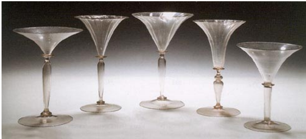
5 Kelchgläser aus farblosem Glas, Venedig oder Façon de Venise, 16./17. Jh., H. 15 - 18 cm. Abbildung aus dem Auktionskatalog von Christie's, London, 28. 3. 2000, Nr. 246 - 250.