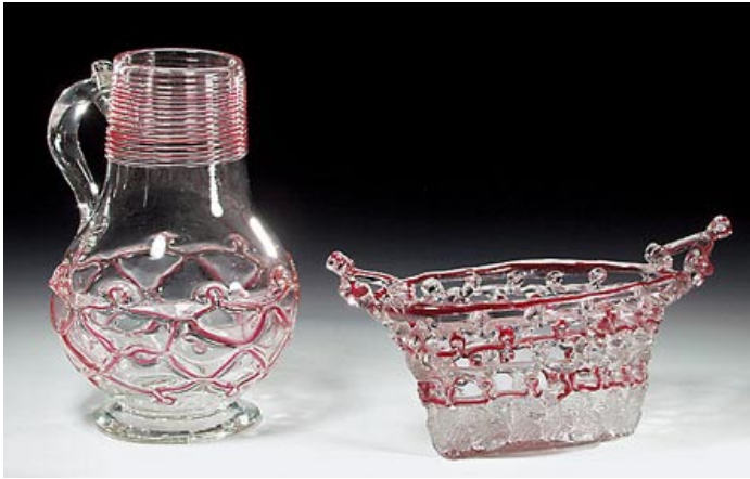
17 Krug und Körbchen aus farblosem Glas mit aufgeschmolzenen Rubinglasfäden. Böhmen oder Bayerischer Wald, 18./19. Jh. Krug H. 23 cm, Körbchen L. 26,5 cm. Abbildung aus Auktionskatalog Fischer, Heilbronn (Zwiesel), 29. 6. 2002, Nr. 80, 81.

Die in Südböhmen auf der Herrschaft Gratzten um 1700-1730 hergestellten und mit „Fluss Amadis“ verzierten Gläser könnten so ähnlich ausgesehen haben. Vgl. Katalog der Ausstellung Buquoy, Passau 2002, (Anm. 38), Abb. 14 (Körbchen)