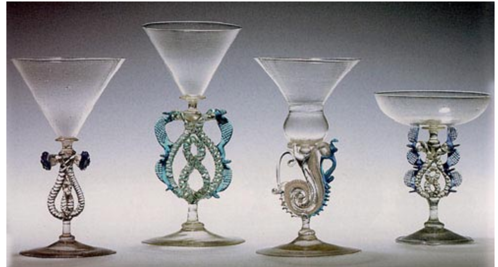
6 Kelchgläser aus mit Flügelschäften, Venedig oder Façon de Venise, 17. Jh., H. 12 - 18,5 cm. Abbildung aus dem Auktionskatalog Christie's, London, 28. 3. 2000, Nr. 157 - 160.