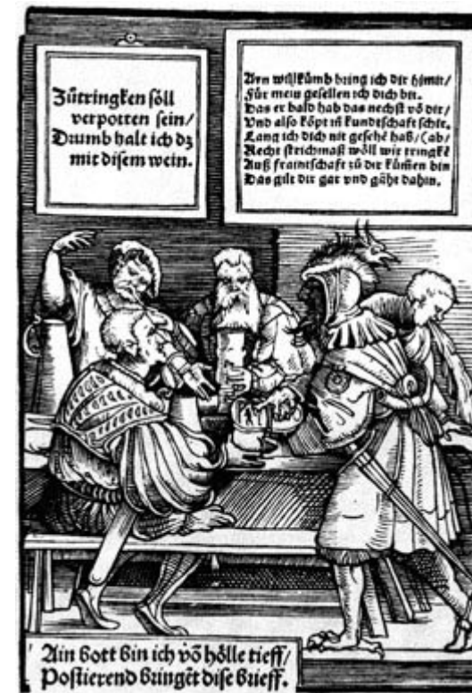
2 Holzschnitt von Hans Burgkmair (?) aus "Ein Büchle wider das zudrincken", Augsburg 1535

Nördlich der Alpen, insbesondere in den deutschen Ländern, waren zu Mathesius' Zeiten offensichtlich völlig andere Trinksitten und -gebräuche verbreitet – man sollte vielleicht lieber von Unsitten und Missbräuchen sprechen – als im Italien der Renaissance. Das prägte die Formen der Gläser, und welchen Unfug man in Deutschland mit ihnen beziehungsweise ihrem Inhalt trieb, schildert der Pfarrer von Joachimsthal, der die Verhältnisse aus eigener Erfahrung kannte und zweifellos genau wusste, wovon er sprach, mit drastischen Worten, wobei es ihm wohl auch darum ging, seinen Schäflein die Furcht Gottes vor dem Alkohol einzubläuen. Er lag damit ganz auf der Linie seines Lehrers Martin Luther, der beklagt hatte: »Wir sind zum Spott und zur Schande aller anderen Lande geworden, die uns halten für schändliche, unflätige Säue, die nur Tag und Nacht trachten, wie sie voll und toll sein.«