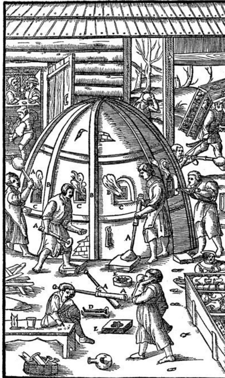
8 Blick in eine böhmische oder sächsische Glashütte in der Mitte der 16. Jahrhunderts. Holzschnitt von Basilius Wefring aus Joachimsthal in Georg Agricolas „De re metallica“, Basel 1556

Zuerst schmelzen die alkalischen Salze – die Flussmittel – und beginnen auf den Sand einzuwirken. Im Verlauf von etwa zehn bis zwölf Stunden – zu Neris und Kunckels Zeiten dauerte es mehrere Tage – fängt die schmelzende Glasmasse zu brodeln an,