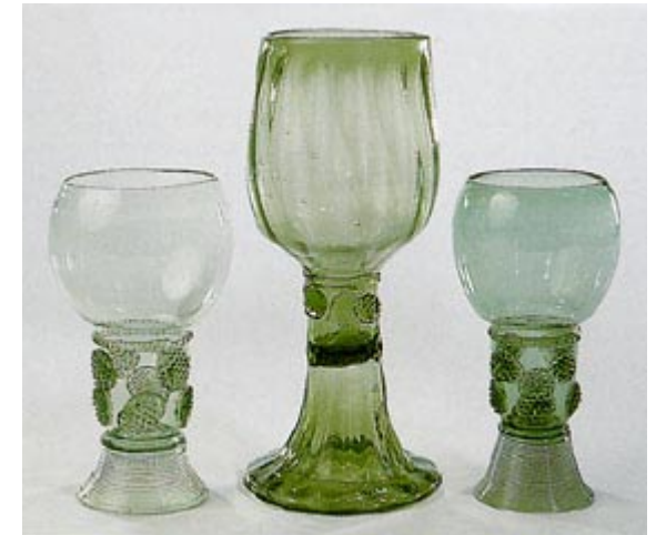
7 Römer in verschiedenen Grüntönen, Deutschland, 17. Jh., H. 13,5 / 19,5 / 13,5 cm. Abbildung aus dem Auktionskatalog Fischer, Heilbronn, 17. 10. 1998, Nr. 203, 208, 204