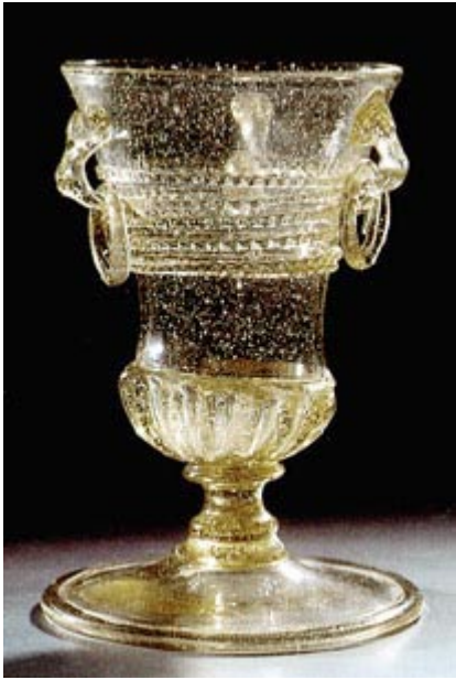
9 Fußbecher mit Ringen, Deutschland, 17. Jh., H. 11,5 cm. Abbildung aus dem Auktionskatalog Fischer, Heilbronn, 27. 10. 2001, Nr. 45.

Beispiel für ein durch winzige Gasblasen „blesicht“ oder „gispig“ gewordenes Glas. Die gelbliche Farbe rührt vom Eisengehalt des verwendeten Sandes her; bei der Schmelze wurde wahrscheinlich kein Braunstein als Entfärbungsmittel verwendet.