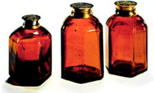
11 Sechskantig geschliffene Rubinglasfläschchen mit vergoldeter Messingmontierung, Potsdam, um 1700, H. 5,5 - 6,5 cm. Kunstgewerbemuseum Prag.

Solche Fläschchen findet man gelegentlich in luxuriösen Toilette-Garnituren Augsburger Gold- und Silberschmiede aus der Zeit um 1690 bis 1700, z. B. mit der Meistermarke TB von Tobias Baur. Zur Abbildung eines Likörservices aus sechs konischen Bechern und einem schlanken, hohen Flakon, alle eckig geschliffen, mit vergoldeter Silbertazza und originalem Etui, vom Meister Daniel Winterstein in Augsburg, das vor 1690 entstanden ist, siehe Dreier 1996 (Anm. 36), Fig. 26, Seite 45.