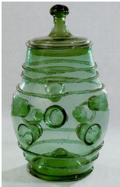
1 Daumenglas mit Deckel, Deutschland, 17. Jh., H. 28,5 cm. Abbildung aus dem Auktionskatalog Fischer, Heilbronn, 17. 10. 1998, Nr. 274.

Vor 500 Jahren gab es in Europa im Grunde zwei Sorten Glas: das auf der Insel Murano geschmolzene so genannte venezianische Glas mit der Reinheit und Durchsichtigkeit