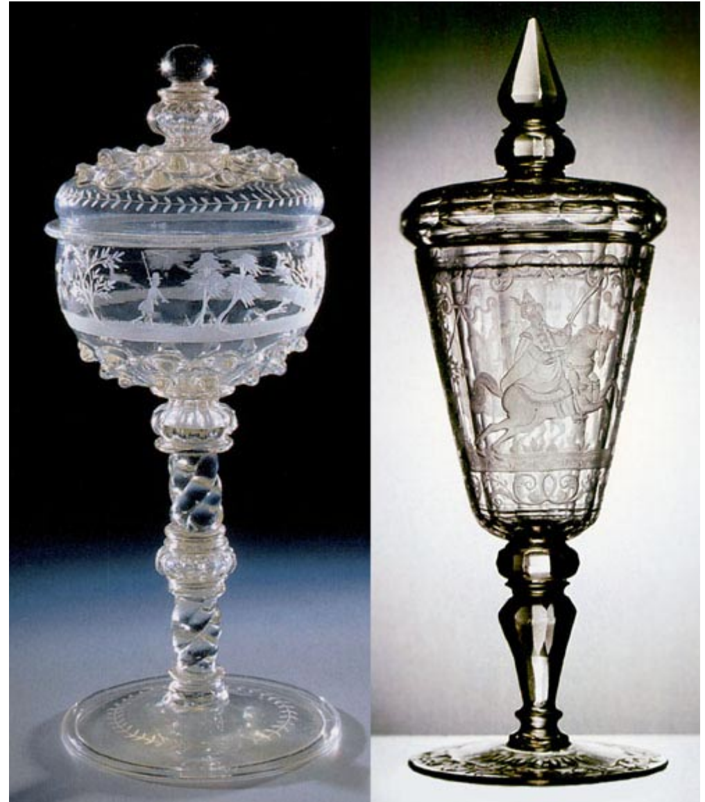
18 Deckelpokal aus farblosem Glas mit gekniffenen Verzierungen am Kuppansatz und auf der Deckelwölbung. Böhmen, um 1690, H. 30 cm. Auktionshaus Dr. Fischer, Heilbronn, 22. 3. 1997, Nr. 240.

Die in den Jahren 1674 und 1685 gefertigten Gefäße waren, soweit man das den Beschreibungen im Wiener Lagerverzeichnis entnehmen kann, dünnwandig und auf venezianische Art geblasen, geformt und verziert. Andererseits scheint es, dass auf der Heilbrunner Hütte, wo bis zu ihrem Ende 1677 einheimische, also böhmische Glas-