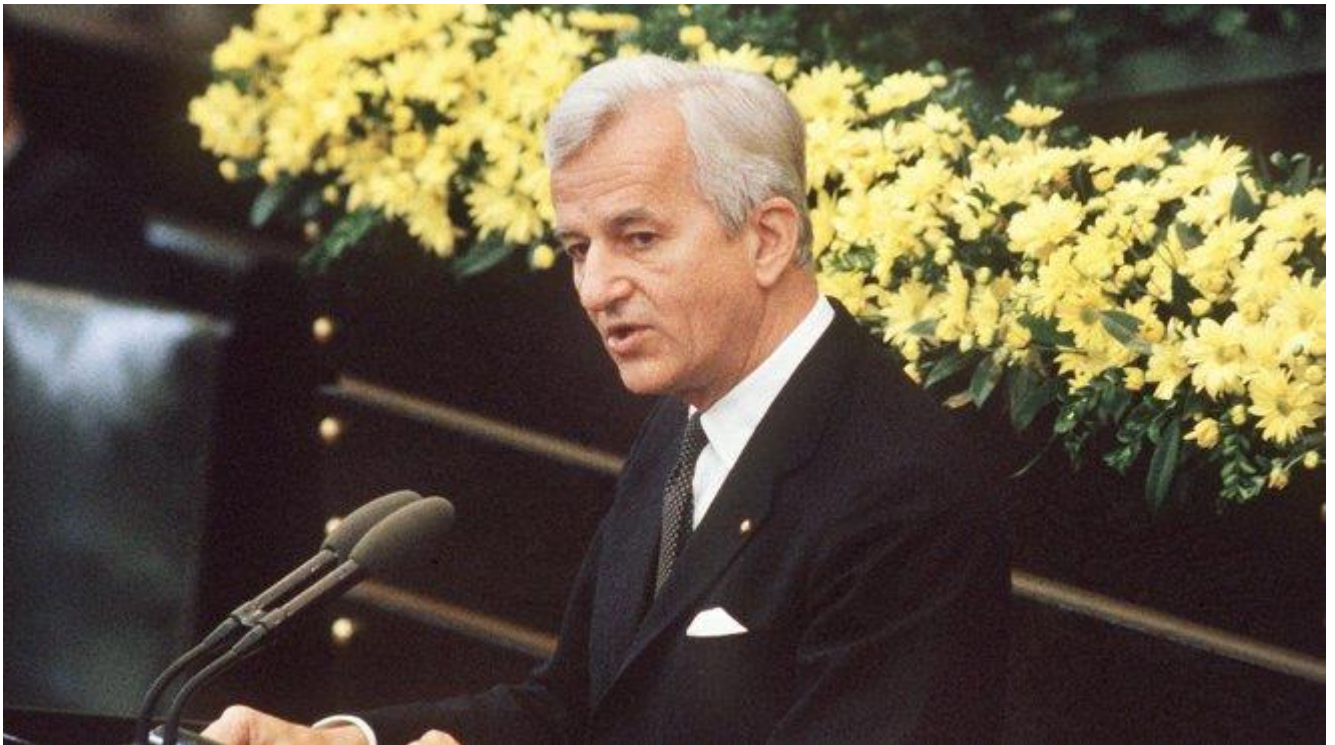
Der damalige Bundespräsident Richard von Weizsäcker 1985 während seiner Rede im Bundestag

Schmerzliche der Vergangenheitsbewältigung herausstrich, hatte man dem Schmerz der Opfer etwas, ein kleines Etwas wenigstens, entgegensetzen.