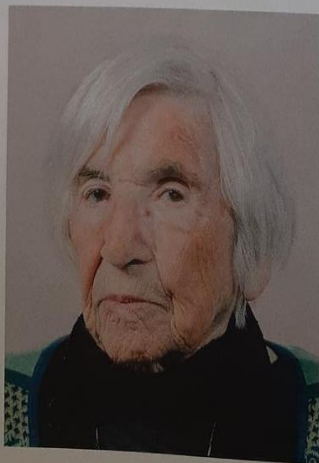
Esther Bejarano, Jahrgang 1924 • Die junge Frau hat Auschwitz überlebt, weil sie Akkordeon spielte. Sie will nach Palästina auswandern.

17. Juli Im Schloss Cecilienhof in Potsdam wird die Konferenz eröffnet, auf der Premierminister Winston Churchill, der sowjetische Diktator Josef Stalin und US-Prä-