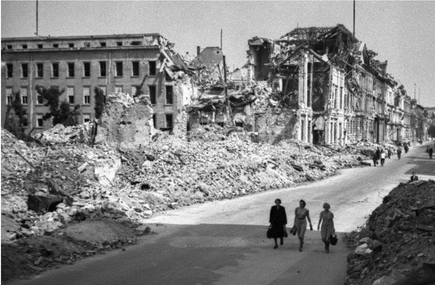
Drei Frauen im zerstörten Berlin 1945