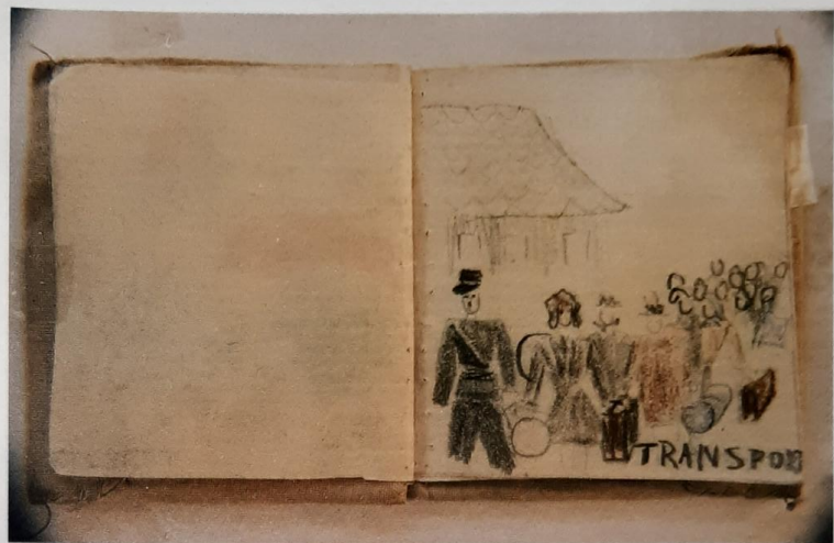
Internierte Polach in Theresienstadt 1942, Polach-Skizze aus Theresienstadt: »Bis zu 60 Menschen in einem Raum«

Kraus: Die Natur folgt bestimmten Gesetzen, wenn keine Nahrung mehr da ist. Sie weiß, worauf man verzichten kann: zuerst die Fettschicht, danach die Muskeln. Die Brüste gehen weg, werden ganz flach, der Bauch sinkt ein, die Oberschenkel bilden sich zurück. Ich konnte am Ende zwischen meine Oberschenkel die ganze Hand legen, normalerweise gibt es bei einer Frau kaum Raum dazwischen. Der Körper weiß genau, was wesentlich ist und was möglichst lange erhalten bleiben muss.