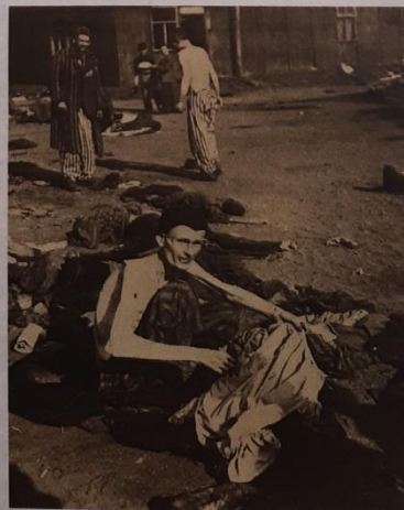
Ex-Häftlinge in Bergen-Belsen 1945 »Weder Nahrung noch Wasser, nichts«