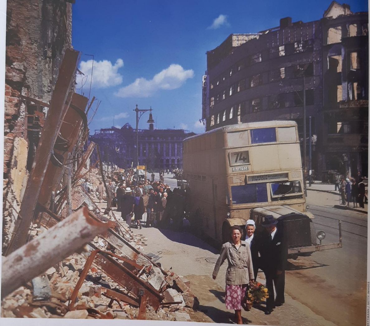
Passanten in der Potsdamer Straße in Berlin im Juli 1945 (im Hintergrund das zerstörte Kaufhaus Wertheim)