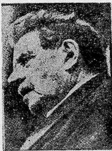
Herriot, que foi reeleito presidente da Assembléia

A discussão em torno do cargo de Primeiro Vice-Presidente deve-se a que este ocupa o cargo de Chefe do Governo no caso de dissolução do Parlamento, se o Presidente da Assembléia não puder cumprir esta tarefa. No ano passado o comunista Jacques Duclos atuou como Secretário-Geral e a maioria procura evitar que seja reeleito.