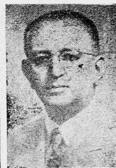
Ministro Morvan Figueiredo

NOVA YORK, 13 (AFP) — Uma manifestação, organizada pela seção novayorkina do Partido Comunista Americano foi feita hoje diante do consulado geral do Brasil, em protesto contra a cassação dos mandatos dos Deputados comunistas brasileiros. Os manifestantes, que compreendiam representantes de diversos sindicatos, entregaram às autoridades consulares brasileiras uma mensagem, em que além do protesto sobre os mandatos, protestavam contra a repressão, no Brasil, a jornais comunistas.