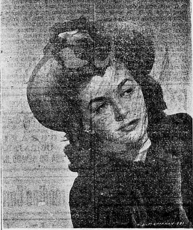
Um dos belíssimos modelos de Hollywood que está competindo com Paris, Londres e New York através à tela privilegiada do CINEAC

Notáveis modelos em desfile na tela do Cineac