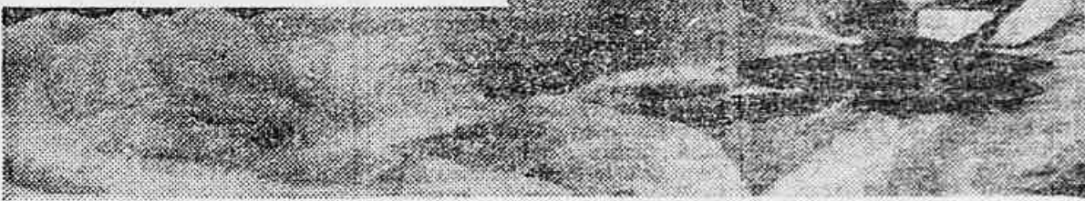
Der Mahatma Gandhi, eine der staerksten und reinsten Persoenlichkeiten unserer Zeit, begann seinen "Hungerstreik bis zum Tode", um die Intoleranz zu bekaempfen.

Neu Delhi, 14. (AFP) — Der Mahatma Gandhi, der heute bereits einen Tag lang in Hungerstreik ist und damit einen Druck auf die intoleranten Elemente in Verwaltung und Regierung ausueben will, erklarte vor einer grossen Anzahl von Personen, die ihn besuchten: "Ich bin bereit meinen Weg zu Ende zu gehen, denn ich weiss, dass ich auf dem richtigen Wege bin. Und ich werde Toleranz predigen selbst wenn alle Inder und Skhis in Pakistan einmarschieren. Erst wenn alle Muselmanen in Neu Delhi in Sicherheit sind, werde ich von meinem Hungerstreik ablassen. Indien wird ruhig sein, wenn Neu Delhi seine Ruhe hat".