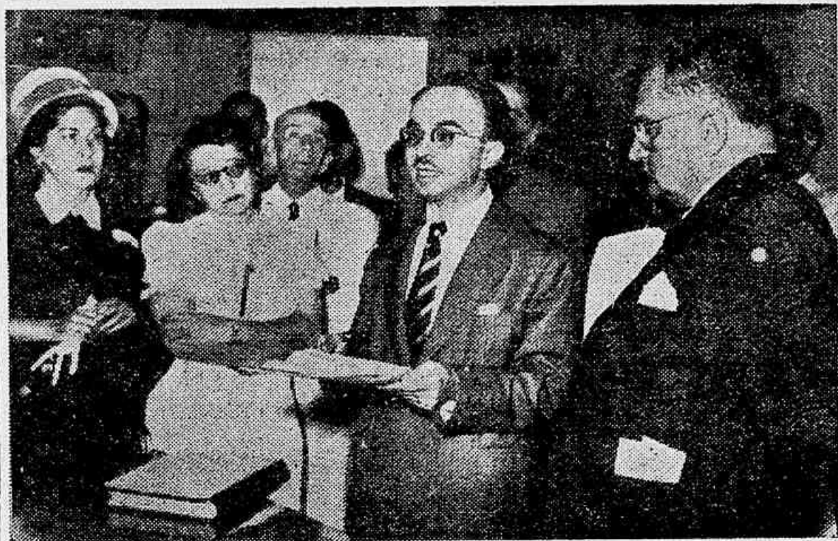
O Sr. Josué Montello, quando pronuncia va o seu discurso, ao ser empossado no cargo de diretor da Biblioteca Nacional

Realizou-se, ontem, à tarde, no gabinete do Ministro da Educação e Saúde, a solenidade da posse do escritor e jornalista Sr. Josué Montello no cargo de Diretor da Biblioteca Nacional, recentemente nomeado pelo Presidente da República. Estiveram presentes o senador Vitorino Freire e um grande número de intelectuais, parlamentares, jornalistas e figuras de prestígio da sociedade.