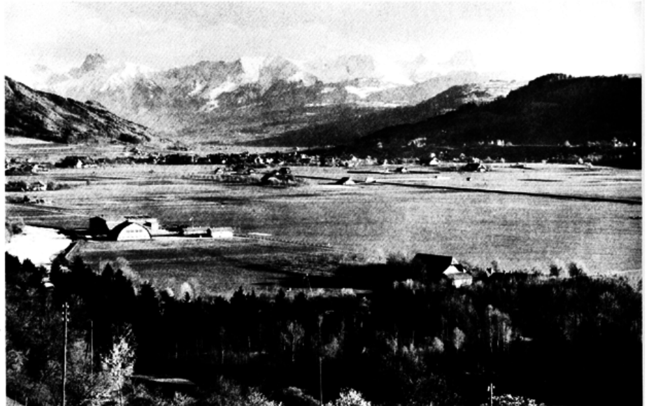
Flughafen Bern-Belpmoos 1930, im Mittelgrund links der Bider-Hangar